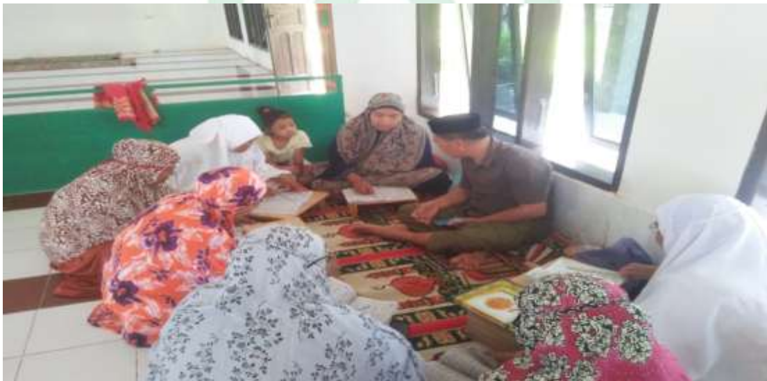
Proses Pemberian Bimbingan Islam Terhadap Ibu-Ibu yang Buta Aksara Al-quran di Mesjid Nurul Amin di Desa Padang Loang Kecamatan Patampanua Kabupaten Pinrang