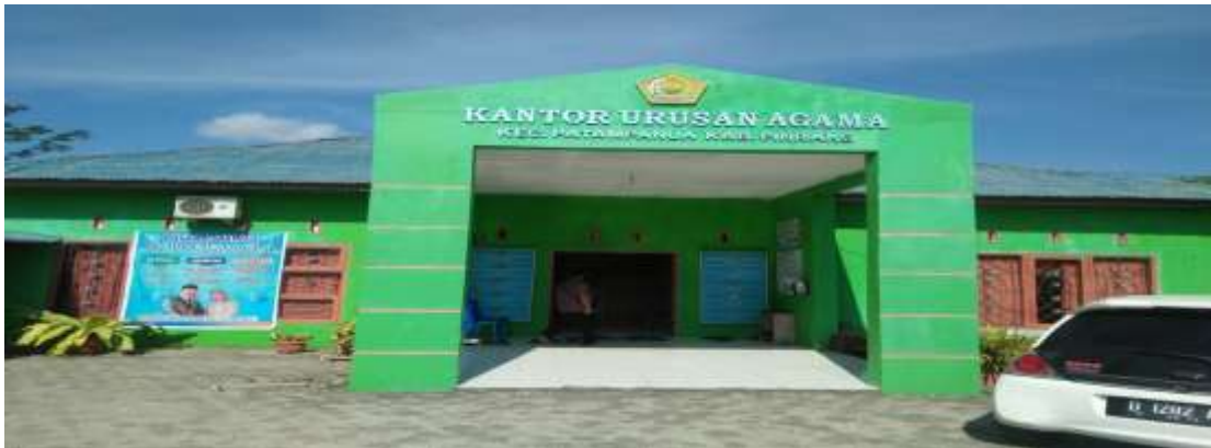
Gambar Kantor KUA Kecamatan Patampanua Kabupaten Pinrang