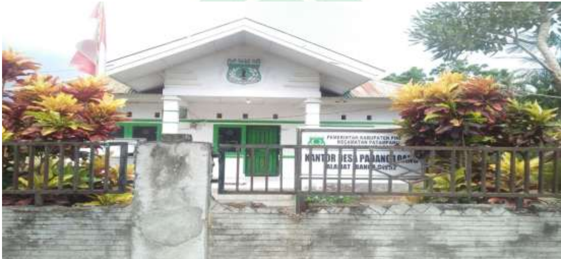
Gambar Kantor Desa Padang Loang Kecamatan Patampanua Kabupaten Pinrang