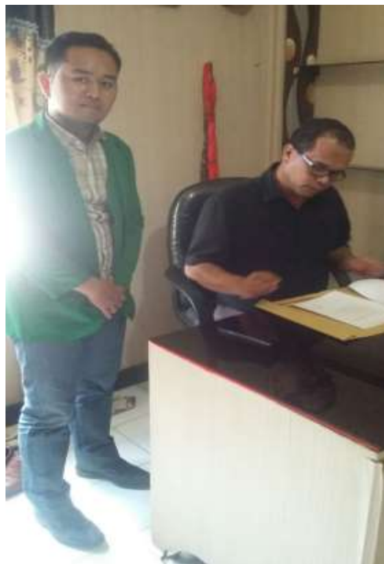
Foto bersama dengan kepala unit narkoba polres polewali mandar

Universitas Islam Negeri Alauddin Makassar. Alhamdulillah Penulis dapat menyelesaikan tugas akhir dengan Skripsi yang berjudul “Peranan Polri Dalam Menanggulangi Tindak Pidana Penyalahgunaan Narkoba Di Polres Polewali Mandar”.