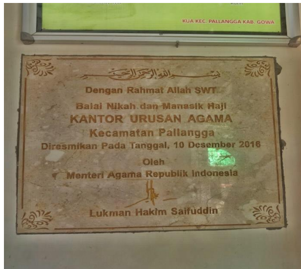
Gambar 1.2 Peresmian KUA Kecamatan Pallangga