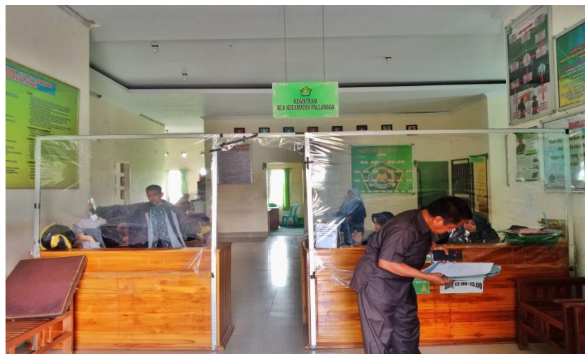
Gambar 1.4 Ruang Utama dan Registrasi di KUA Kecamatan Pallangga