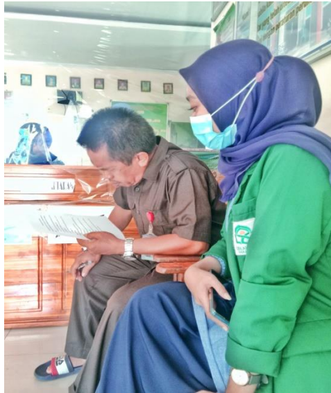
Gambar 2.1 Penyerahan Surat Izin Penelitian di KUA