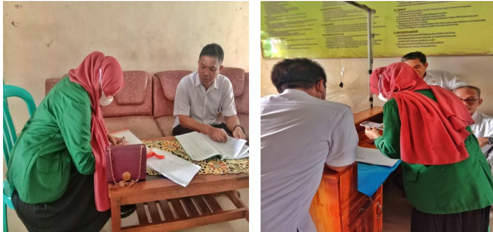
Gambar 4.1 & 4.2 Pengambilan data KUA Pallangga