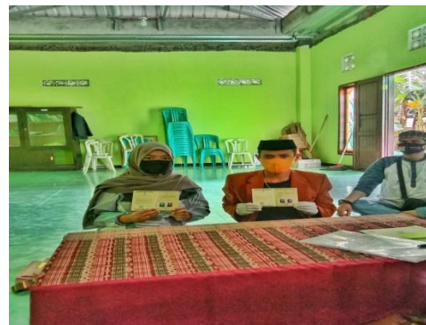
Gambar 3.1&3.2 Prosesi Pernikahan yang dilakukan di KUA Pallangga