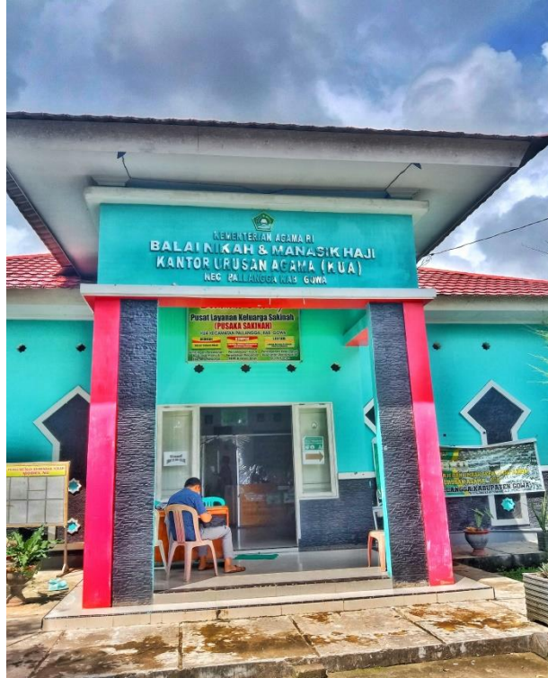
Gambar 1.1 Lokasi Penelitian di KUA Kecamatan Pallangga, Kabupaten Gowa