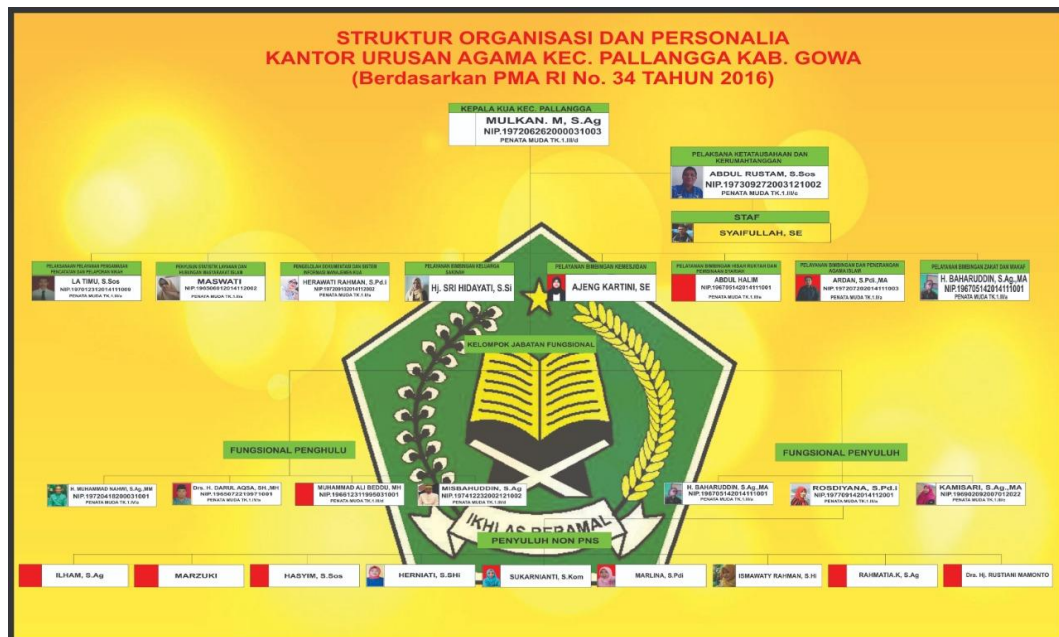
Gambar 1.3 Struktur Organisasi KUA Kecamatan Pallangga