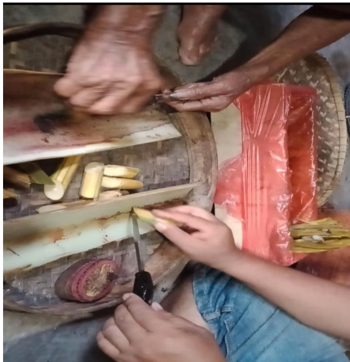
Proses pembersihan keris, dengan cara menyikat, Wonomulyo 21 Agustus 2020.