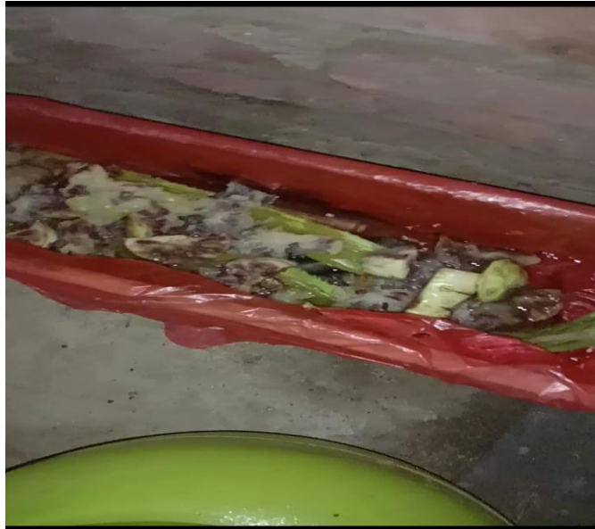
Proses perendaman selama 3 hari 3 malam, Wonomulyo 21 Agustus 2020.