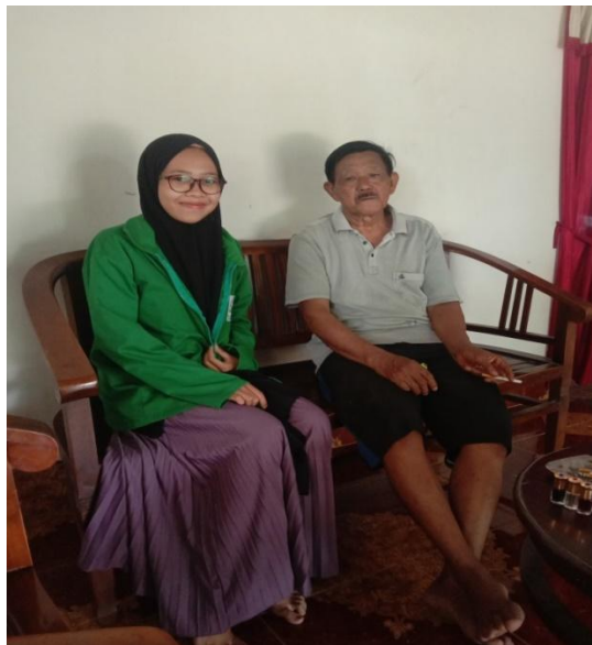
Wali, selaku, warga masyarakat yang melaksanakan Ritual, Wonomulyo 16 Maret 2021.