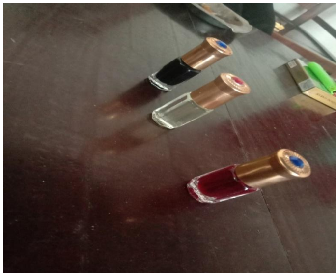
Jenis parfum yang digunakan pada saat selesai pencucian keris, Wonomulyo 16 Maret 2021.