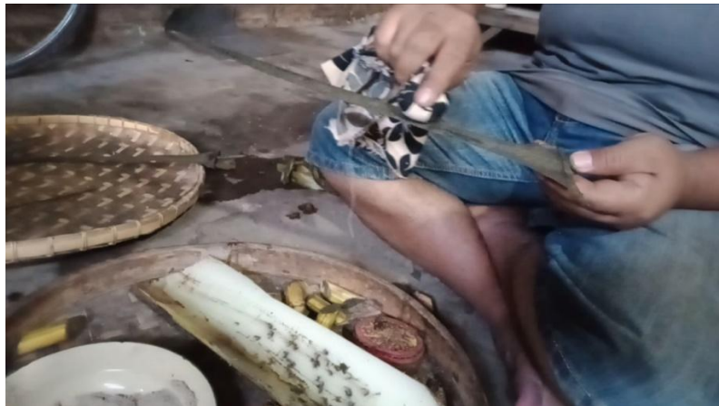
Proses pemberian racun atau bisah, Wonomulyo 21 Agustus 2020