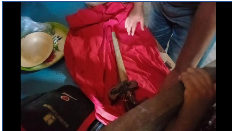
Proses pembungkusan keris, Wonomulyo 21 Agustus 2020.