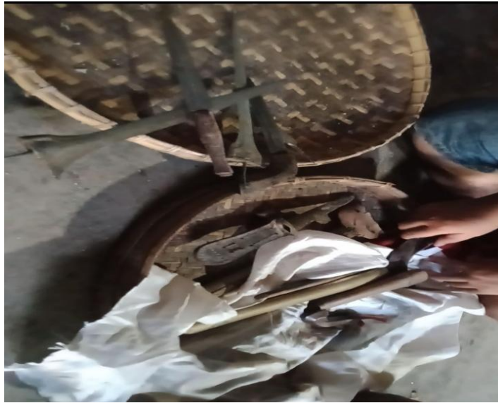
Proses pemasangan keris, Wonomulyo 21 Agustus 2020.