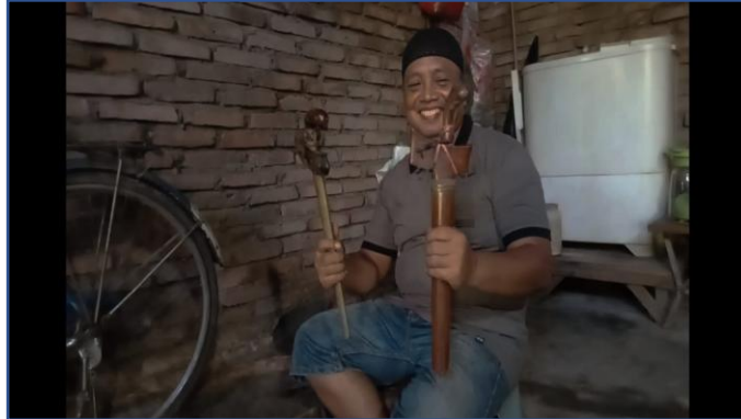
Gambaran Keris Nogososro, Wonomulyo 21 Agustus 2020.