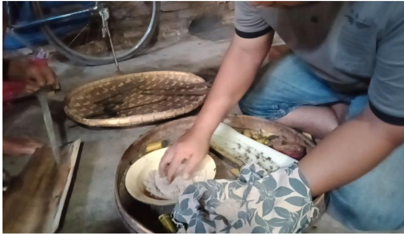
Proses pemberian dedak, Wonomulyo 21 Agustus 2020.