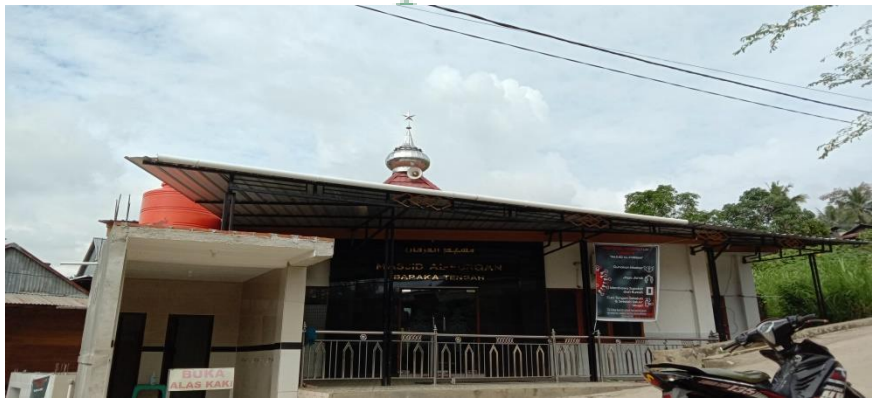
Gambar 4 : Mesjid Al-Furqon, markas DPC Wahdah Islamaiyah Baraka