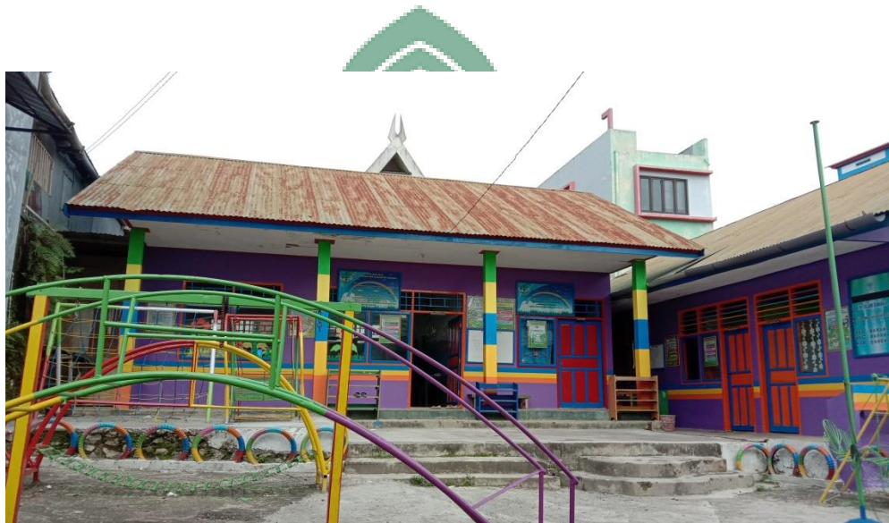
Gambar 7 : TK Islam Terpadu Wahdah Islamiyah ( Baraka )