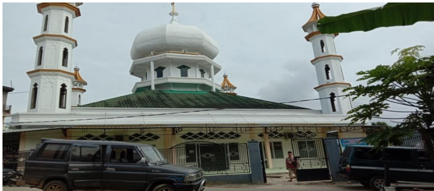
Gambar 3 : Mesjid Ilham Baraka, tempat pertama yang dijadikan sebagai markas Wahdah Islamiya