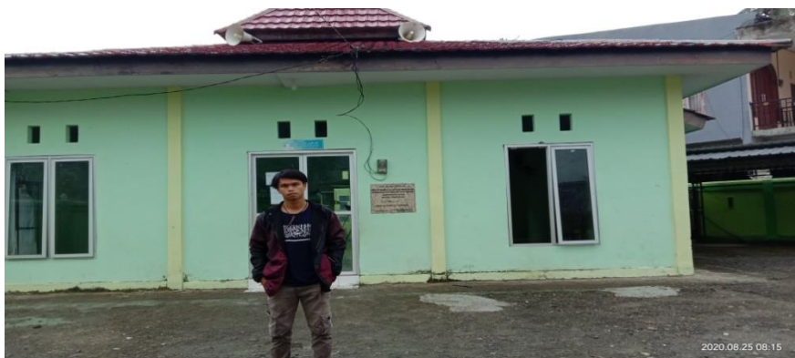
Gambar 5 : Kantor DPD Wahdah Islamiyah Enrekang