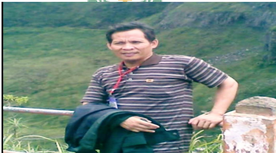
Gambar 2: Ketua DPC Wahdah Islamiyah tahun 2012-sekarang