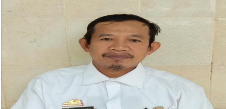
Gambar 1: Ketua DPC Wahdah Islamiyah Baraka tahun 2004-20012