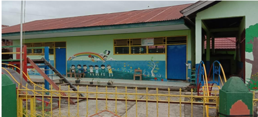
Gambar 6 : TK Islam Terpadu Wahdah Islamiyah ( Balla )