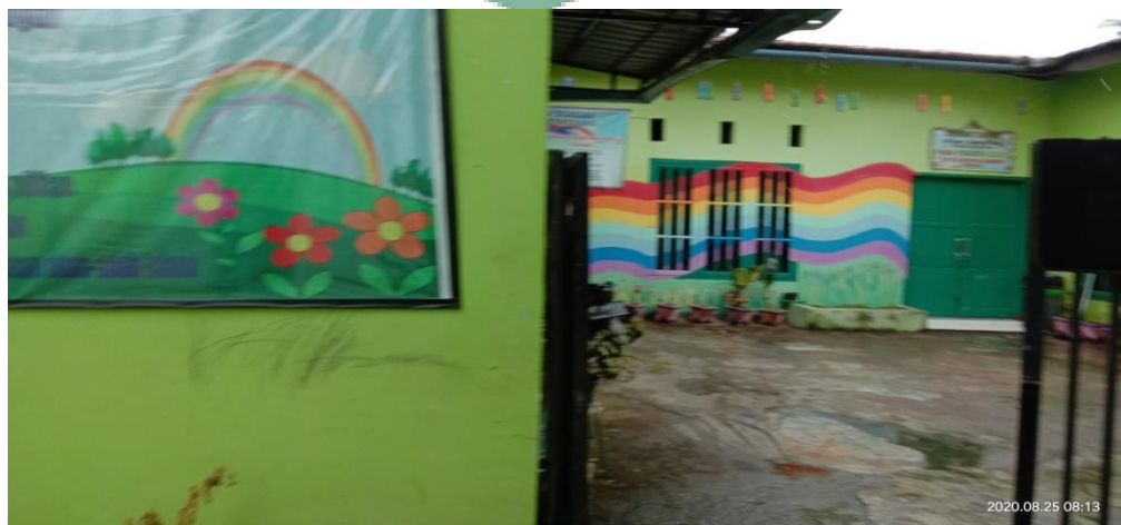
Gambar 9 : TK Islam Terpadu Wahdah Islamiyah ( Enrekang )