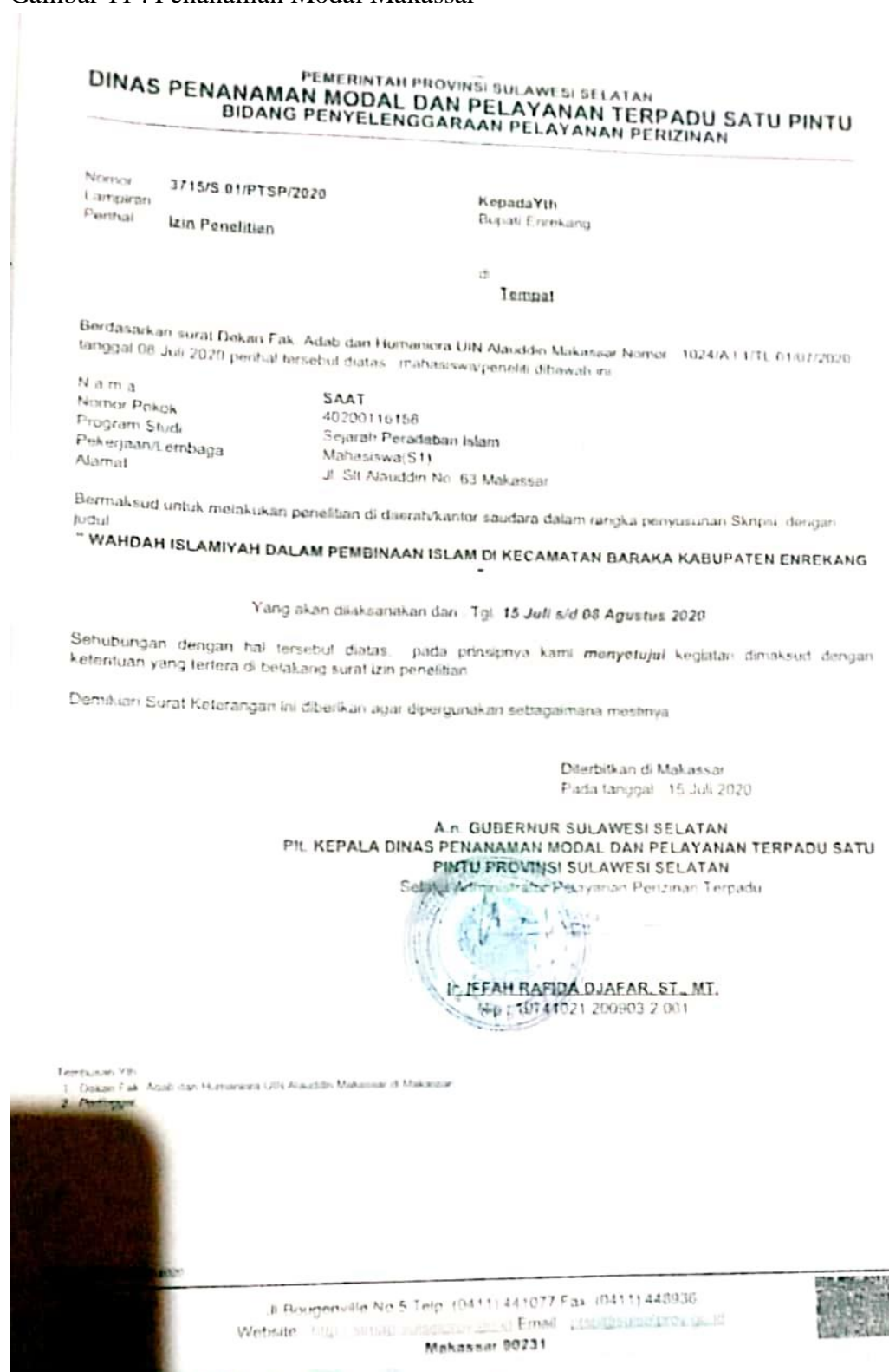
Gambar 11 : Penanaman Modal Makassar