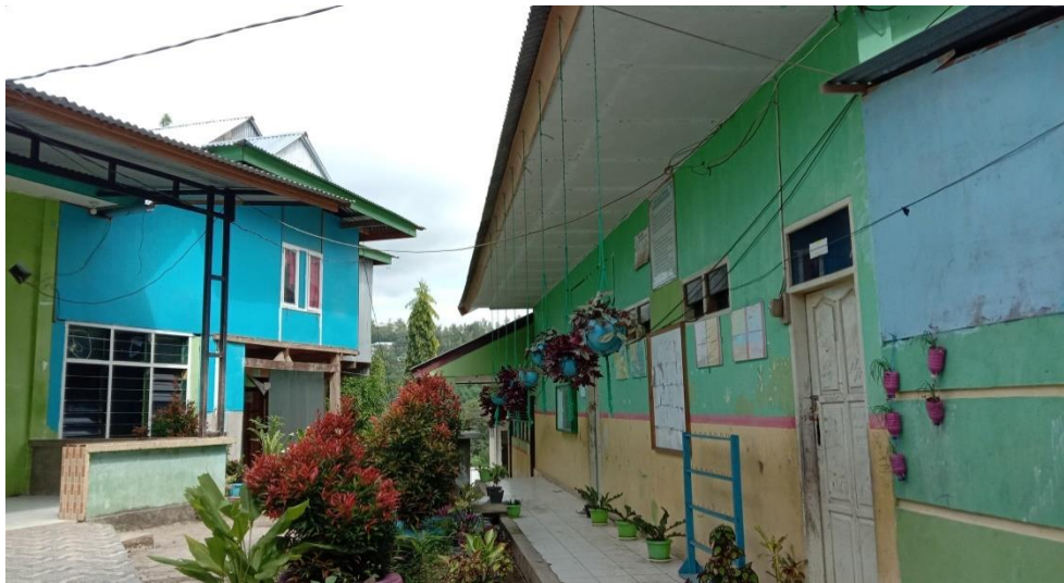
Gamabr 8 : Bagian Dalam Pondok Pesantren Umar Bin Abdul Aziz Rumbo