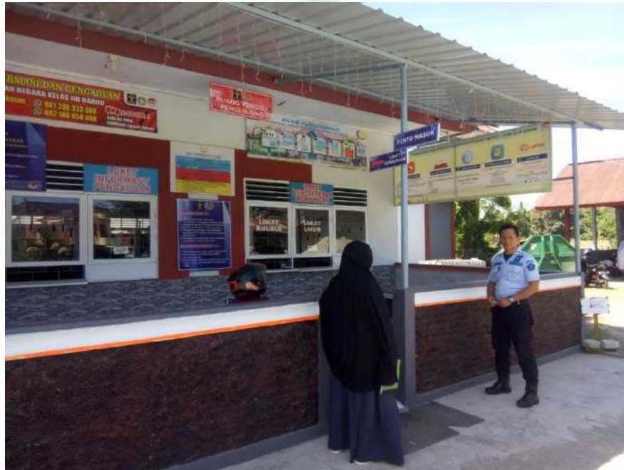
Gambar 1.44 Loker pendaftaran kunjungan