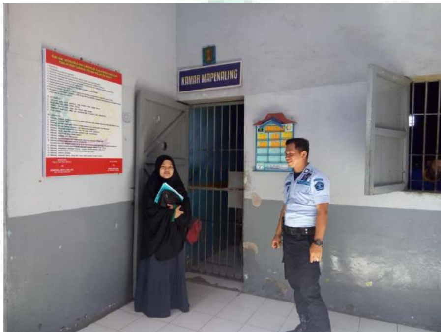
Gambar 1.36 Kamar mapenaling (Masa pengenalan lingkungan)