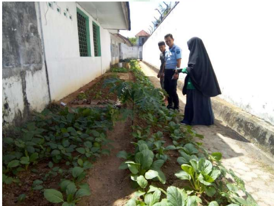
Gambar 1.19 Kegiatan pertanian oleh warga binaan pemasyarakatan (tanaman bayam, kangkung, sawi, labu dan tomat)