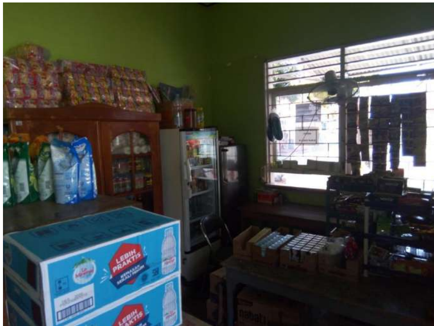
Gambar 1.21 Ruang Koperasi