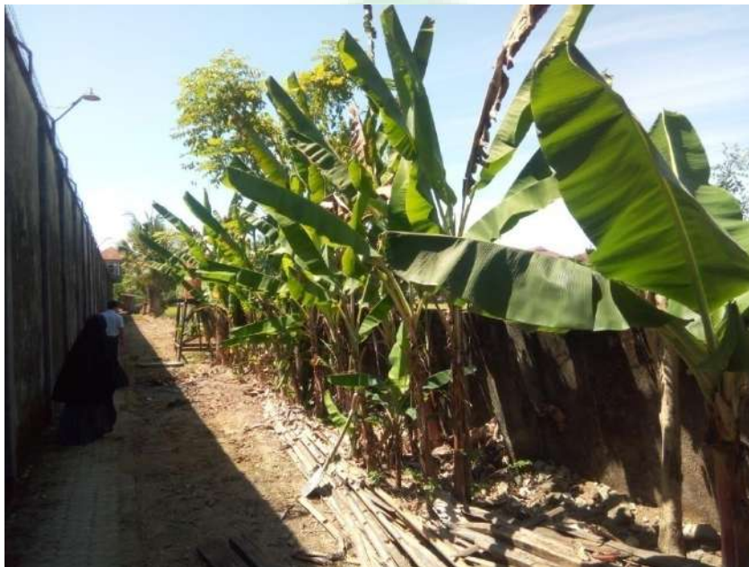
Gambar 1.46 Lahan pertanian di luar Rutan Kelas IIB Barru