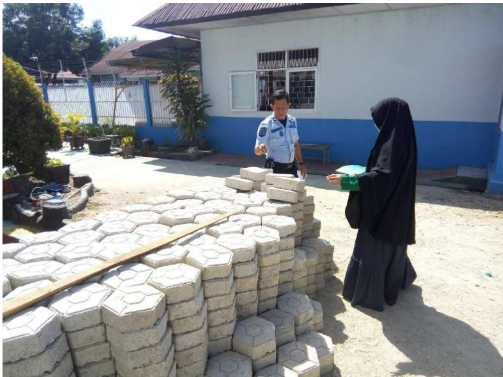
Gambar 1.17 Batako hasil produksi warga binaan pemasyarakatan