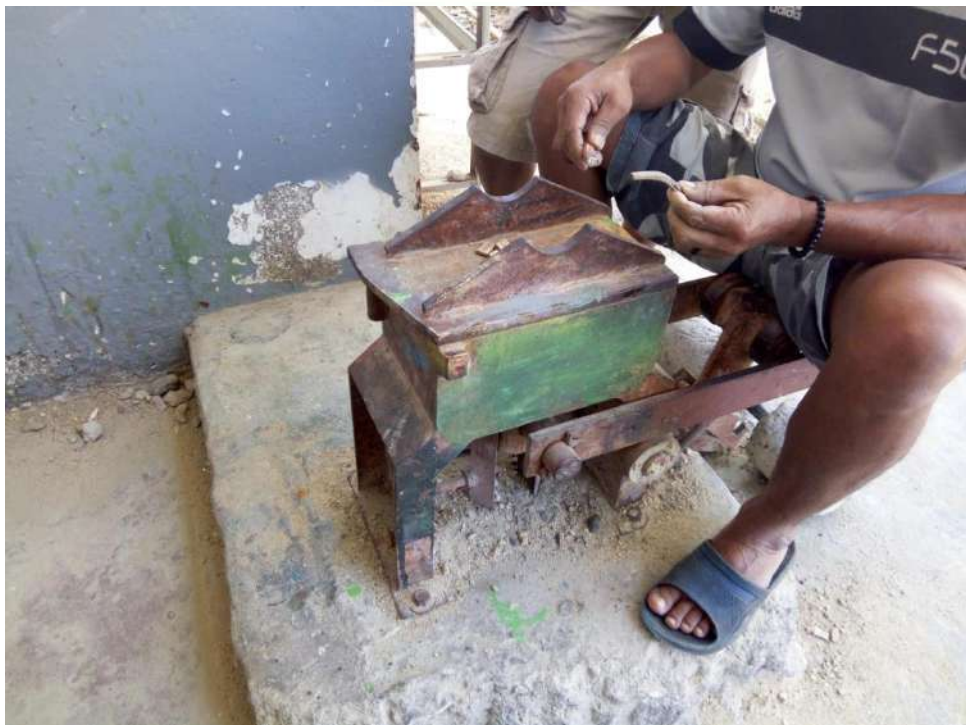
Gambar 1.29 Alat pembuat batako