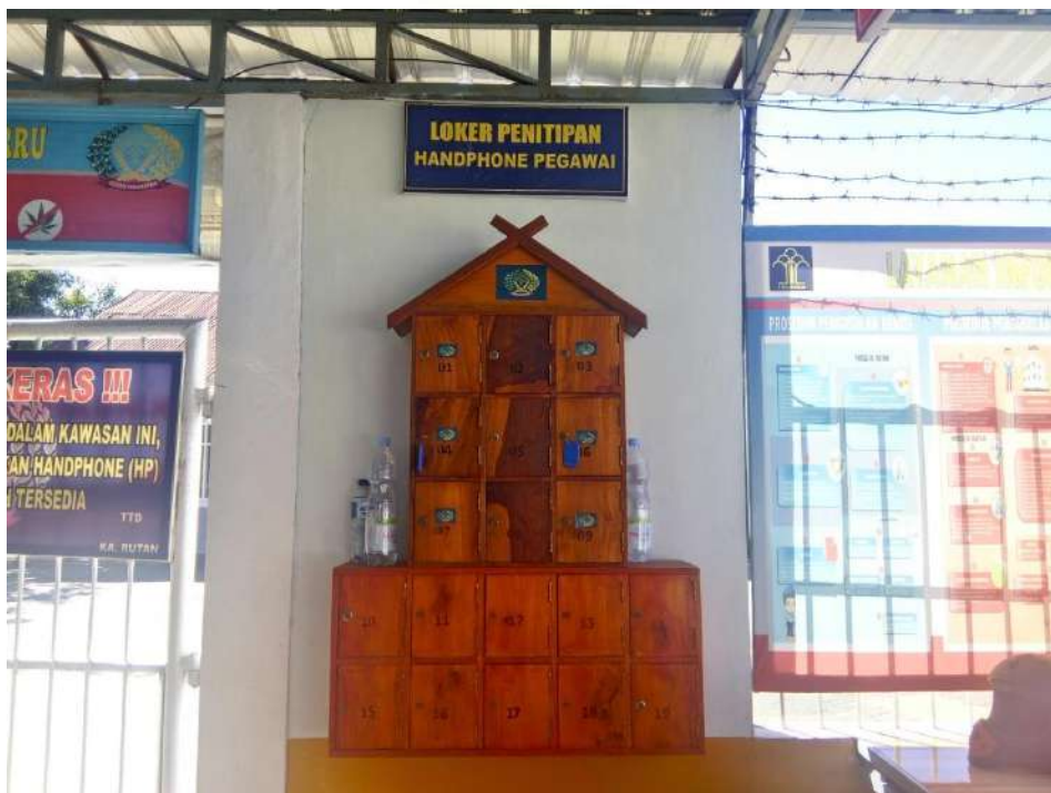
Gambar I.52 Loker penitipan Handphone untuk pegawai