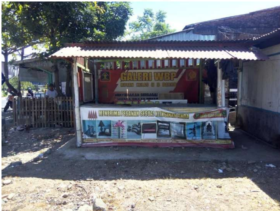
Gambar 1.48 Galeri kerajinan warga binaan pemasyarakatan