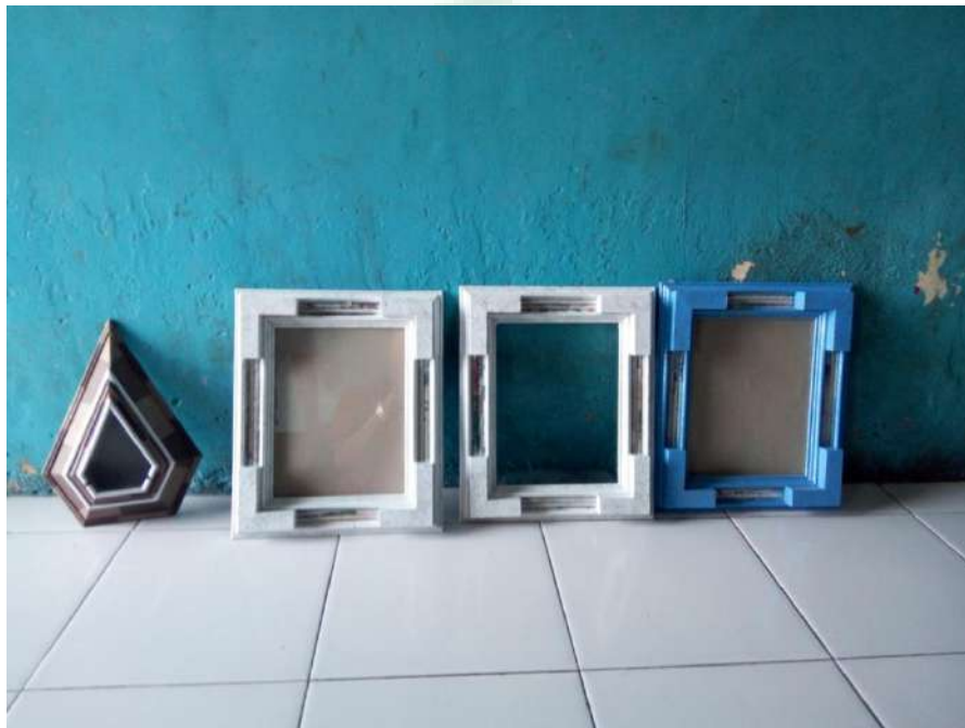
Gambar 1.34 Hasil kerajinan tangan warga binaan pemasyarakatan (bingkai foto dan asbak)