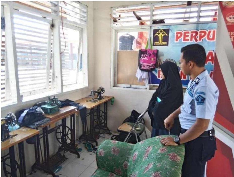
Gambar 1.38 Ruang keterampilan menjahit