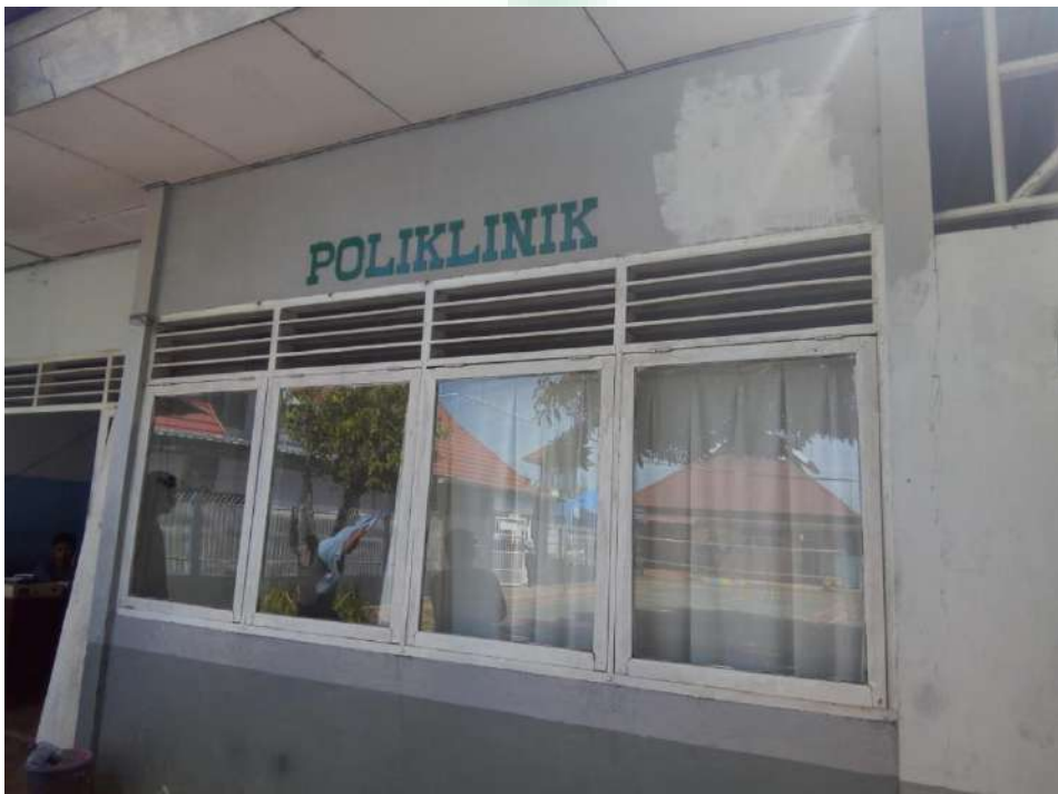
Gambar 1.25 Poliklinik