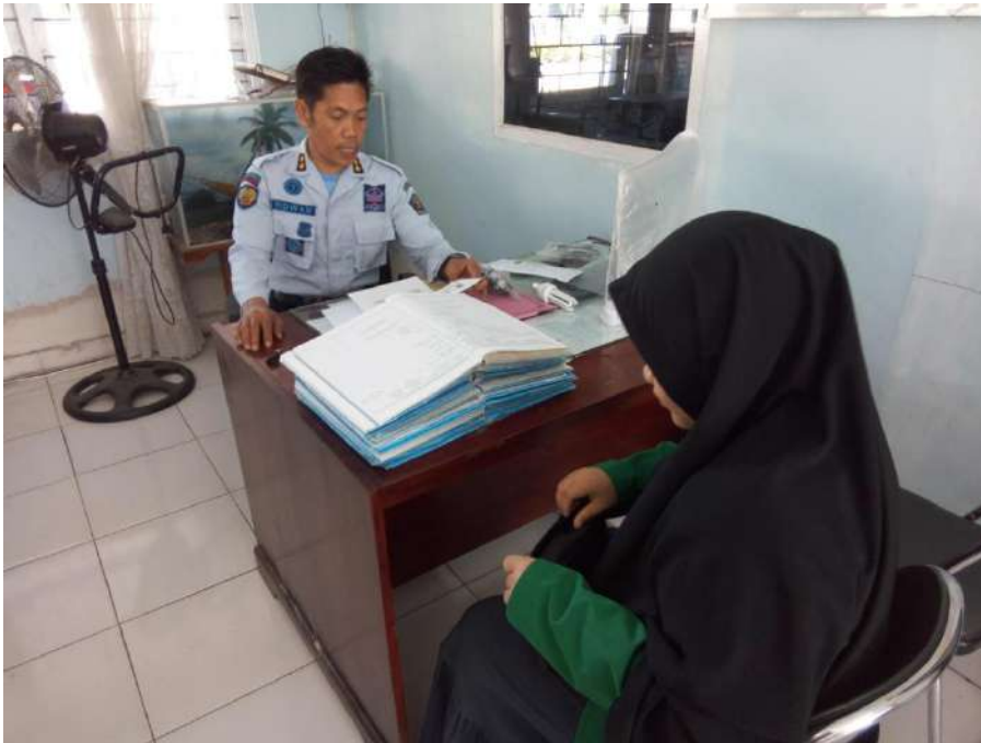
Gambar 1.1 Proses penerimaan oleh pihak RUTAN Kelas IIB Barru