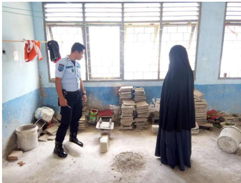
Gambar 1.31 Ruang pembuatan batako