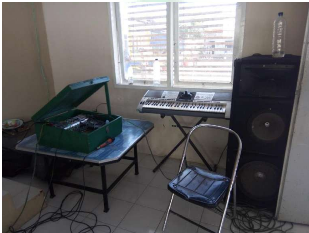
Gambar 1.40 Hiburan untuk warga binaan seperti bernyanyi