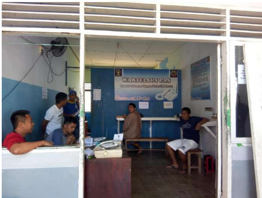
Gambar 1 .23 Fasilitas wartelsuspaspas untuk narapidana