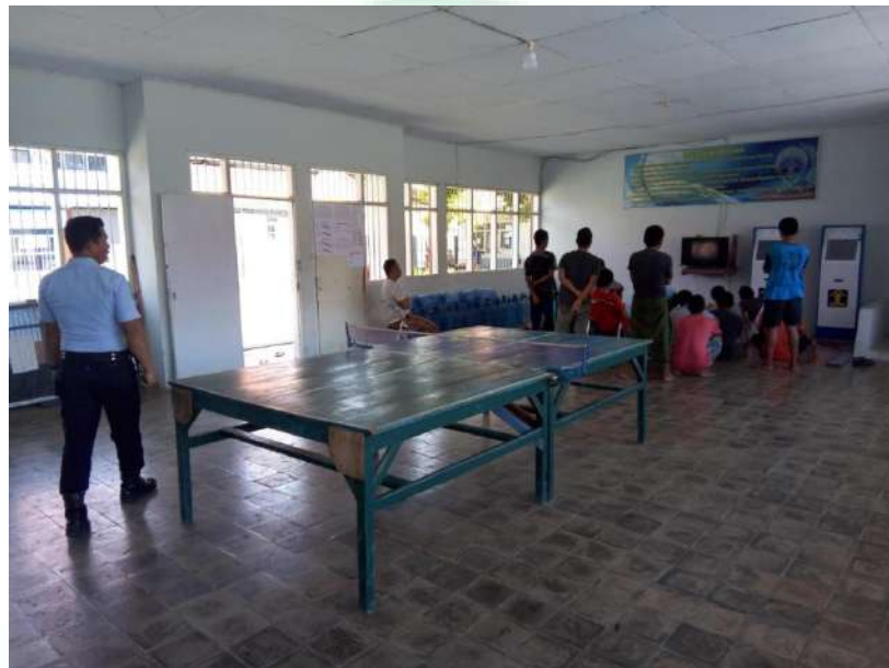
Gambar 1.42 Ruang rekreasi (nonton tv dan tennis meja)