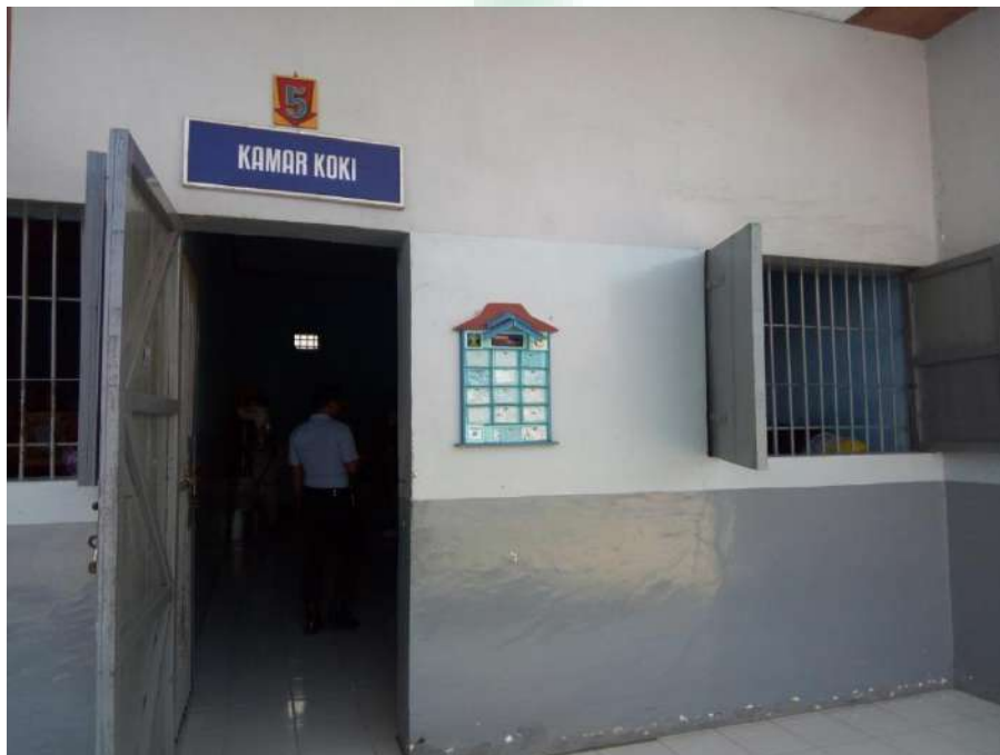
Gambar 1. 27 Kamar koki di blok asri