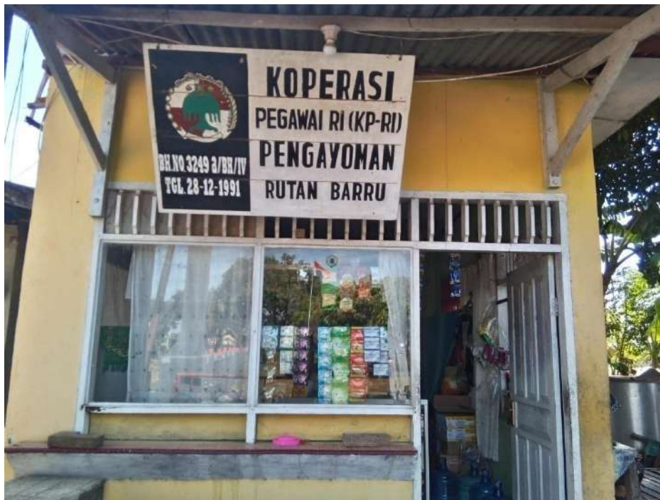
Gambra 1.50 Koperasi luar