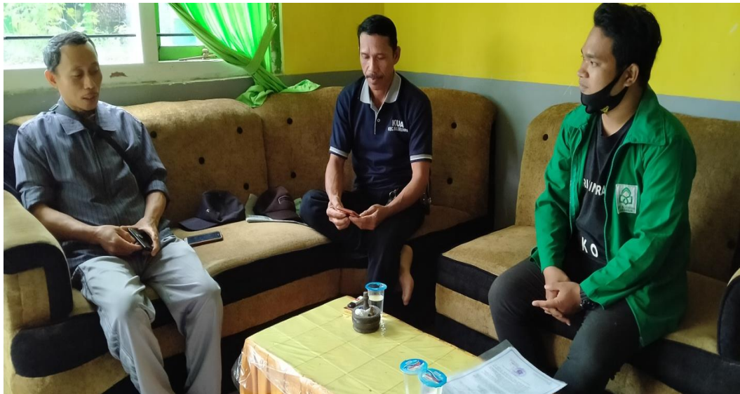
(wawancara dengan Ustads Amir dan Ustads Saharuddin, Penyuluh Agama Islam)