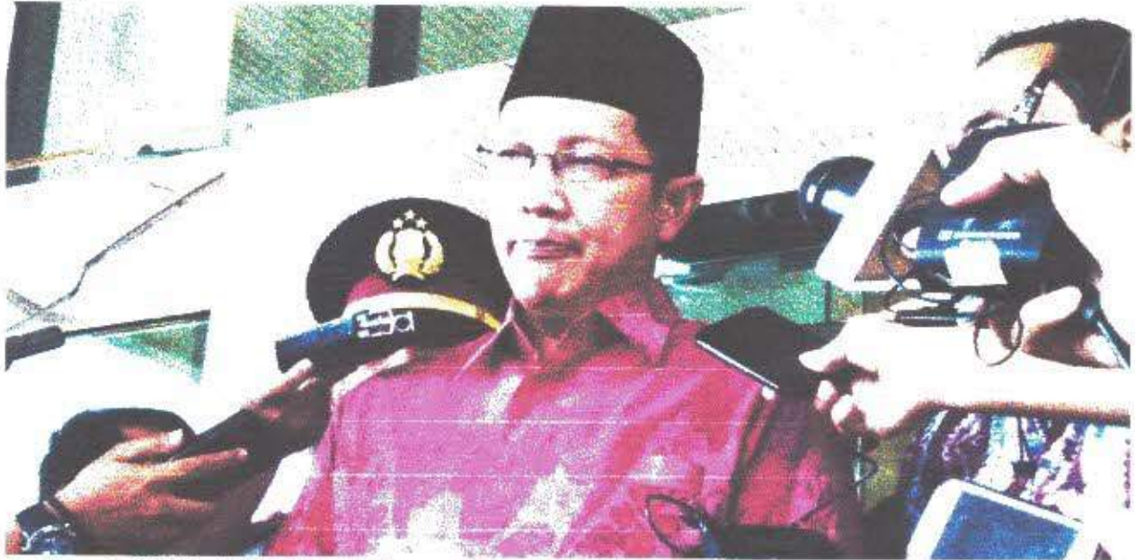
Menteri Agama Lukman Hakim Saifuddin

JAKARTA, KOMPAS.com - Menteri Agama Lukman Hakim Saifuddin menghimbau lembaga-lembaga keagamaan perlu mengambil langkah positif untuk mencari dan menggali akar penyebab seseorang menjadi lesbian, gay, biseksual dan transgender (LGBT), serta melakukan upaya penanggulangan yang berbasis pendekatan agama dan ilmu jiwa. A