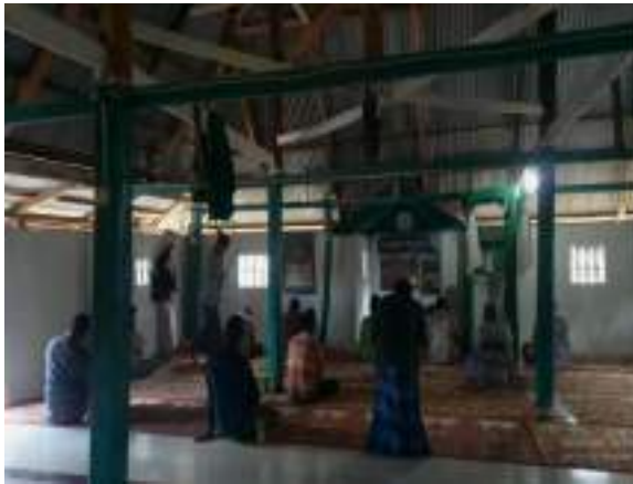
Gambar 4.3 Khotbah Jumat di Gantarang Lalang Bata Sumber: Dokumentasi Peneliti, 2019

Berikut uraian tentang makna yang terkandung dalam tradisi pedang kuno berdasarkan hasil observasi langsung serta wawancara mendalam yang didapatkan dari informan yang memiliki pemahaman mendalam terhadap tradisi pedng kuno. Serta beberapa pendapat dari masyarakat Gantarang dan masyarakat dari luar Gatarang.