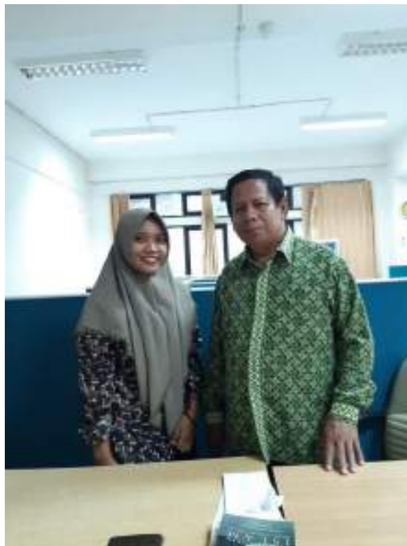
Tokoh Agama/Dosen FTK UIN Alauddin Makassa