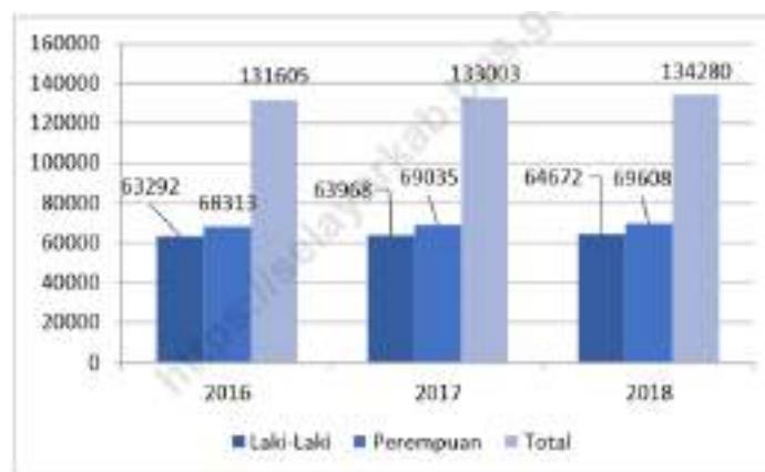
Gambar 4.2 Jumlah Penduduk Kabupaten Kepulauan Selayar Tahun 2018

Jumlah penduduk Kabupaten Kepulauan Selayar pada Tahun 2018 adalah 134.280 jiwa terdiri dari 64.672 jiwa laki-laki dan 69.608 jiwa perempuan, dengan rasio jenis kelamin sebesar 92,91 yang berarti dari setiap 100 penduduk perempuan terdapat 92 sampai 93 penduduk laki-laki. 5