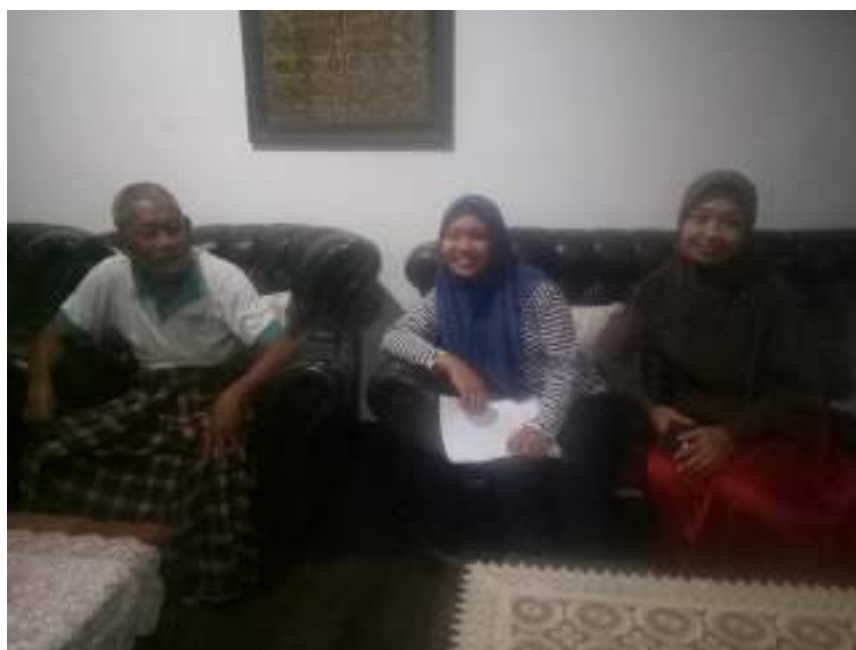
Keluarga Kerajaan Gantarang Lalang Bata