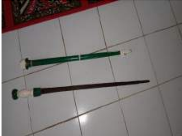
Gambar 1.1 Pedang Kuno

Pangali mengajarkan dan menyebarluaskan Islam hingga kepada keturunan-keturunannya baik di Gantarang ataupun di luar Gantarang.