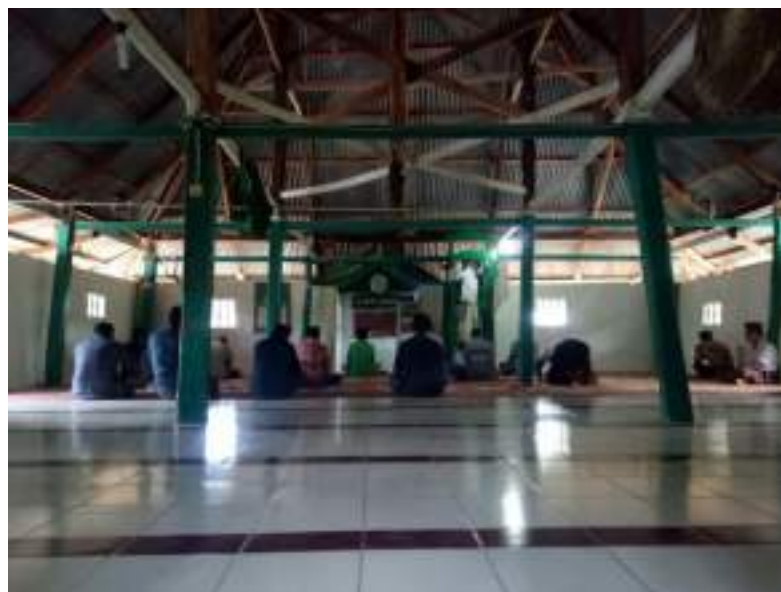
Proses Shalat Jumat