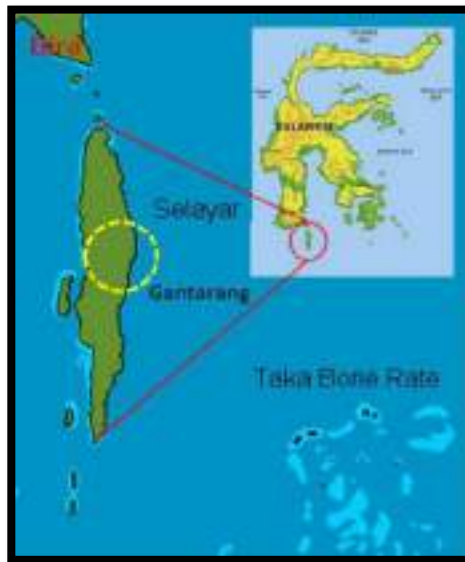
Gambar 4.1 Orientasi Wilayah Penelitian

Tua Awaluddin Gantarang yang menjadi tempat dilaksanakannya tradisi pedang kuno, dimana tradisi tersebut merupakan objek dalam penelitian ini.