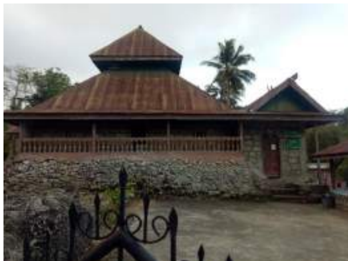
Masjid Tua Gantarang Lalang Bata