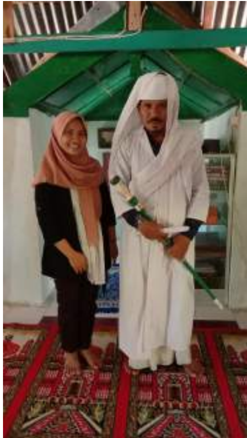
Khatib Masjid Tua Gantarang Lalang Bata