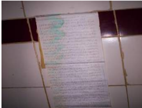
Gambar 1.2 Naskah Khotbah

lengkap dengan serbannya, justru saat ini hanya dilakukan pada hari-hari tertentu saja, yakni pada shalat Idul Fitri dan Idul Adha, sedangkan pada khotbah Jumat tidak lagi diharuskan memakai pakaian serba putih, kecuali jika telah ada perjanjian sebelumnya, semisal untuk keperluan penelitian tentang budaya mereka. Selain dari pakaian, yang mengalami pergeseran juga terjadi pada pembaca khotbah atau khatib. Khotbah yang dibacakan di Gantarang, bukanlah khotbah sembarangan, melainkan khotbah yang telah ada sejak zaman kerajaan Gantarang, yang ditulis dalam bahasa Arab yang panjangnya lebih dari satu meter. Khotbah ini dahulunya hanya boleh dilakukan oleh mereka yang merupakan keturunan kerajaan Gantarang, namun saat ini para tokoh agama Gantarang telah memberi kesempatan bagi mereka berada di luar garis keturunan Gantarang mempelajari naskah khotbah tersebut.