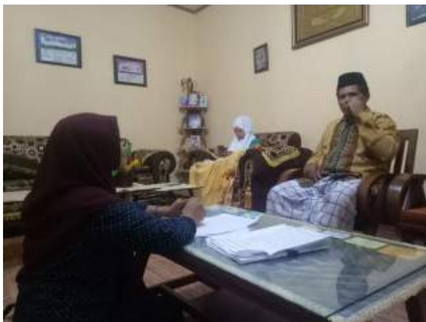
Imam Masjid/Tokoh Agama Gantarang Lalang Bata