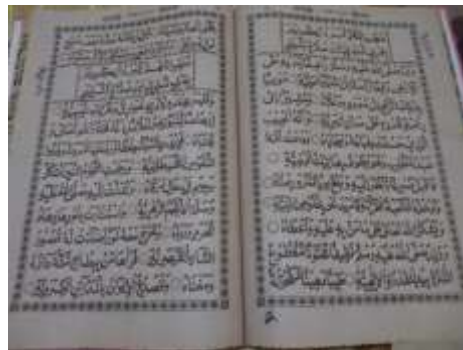
Gambar 4.5. Teks Barzanji

Posisi tersebut sudah mutlak dan tidak bisa ditukar karena bertentangan dengan ade' . Posisi tempat duduk para pemangku adat berdasarkan data temuan peneliti sebagai berikut: