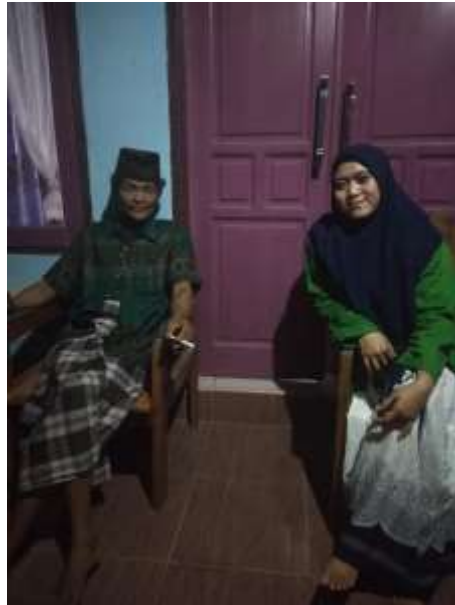
Gambar 3 :wawancara bersama sanro Desa Lamatti Riaja