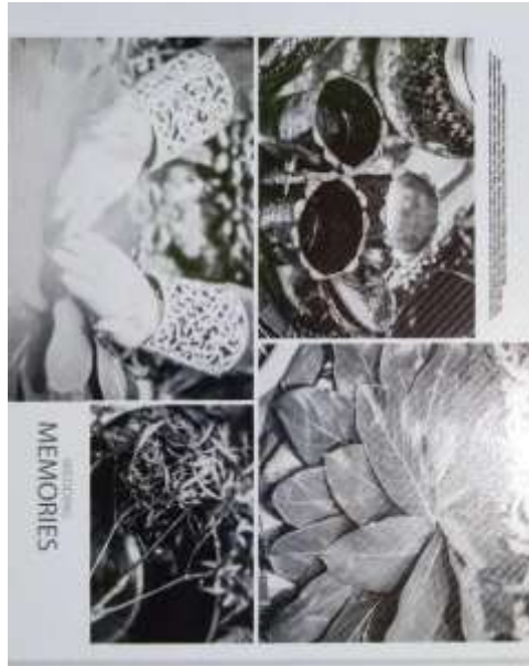
Gambar 5 : Alat dan bahan yang digunakan pada tradisi mappaccing