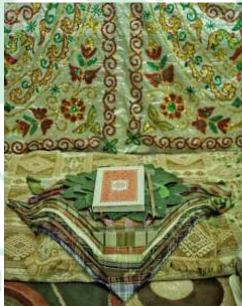
Gambar 6 :Unsur-unsur yang digunakan yang terdapat dalam tradisi mappanre temme'