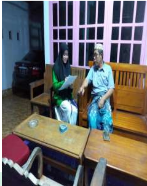
Gambar 1 :wawancara bersama tokoh masyarakat Desa Lamatti Riaja