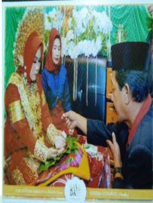
Gambar 3 : Sahabat dekat mempelai perempuan melaksanakan tradisi mappacing kepada mempelai perempuan