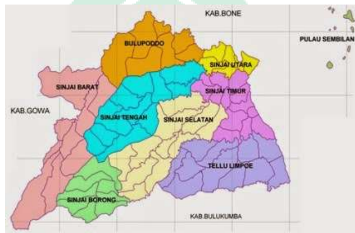
Gambar 4.1 Peta wilayah Kabupaten Sinjai

Secara geografis kabupaten Sinjai terletak pada titik 5^{\circ}21'56'' - 5^{\circ}21'16'' LS dan 119^{\circ}56'30'' - 120^{\circ}25'33'' BT. Kabupaten Sinjai terletak di bagian pantai timur Provinsi Sulawesi Selatan yang berjarak sekitar 223 km dari kota Makassar. Luas wilayahnya berdasarkan data yang ada sekitar 819,96 \text{ km}^2 (81.996 Ha)