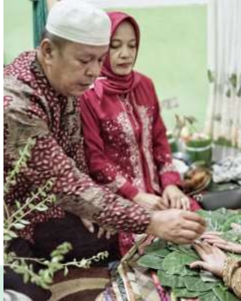
Gambar 1: Bapak/ibu kepala desa melaksanakan mappacing pada mempelai perempuan.