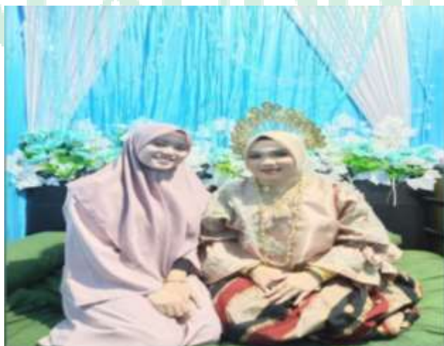
Gambar 4.3. Acara Mappettu ada

Acara selanjutnya yakni mappettu ada artinya menetapkan pembicaraan setelah pelaksanaan proses madduta . Setelah itu disambung dengan mappasirekeng .