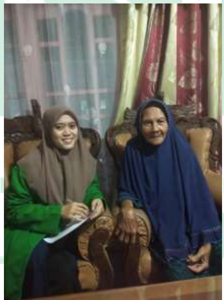
Gambar 4 : Wawancara bersama sanro botting