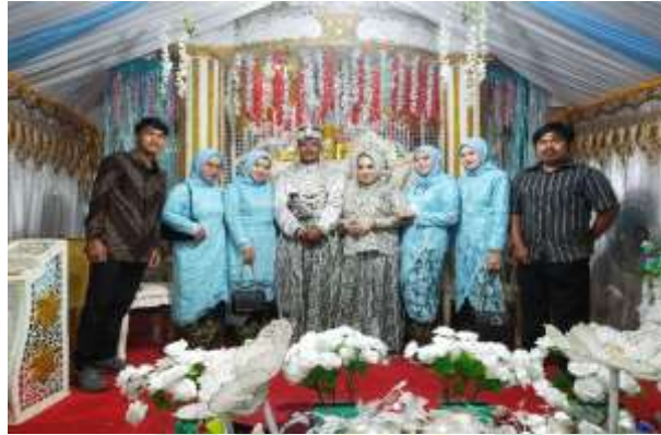
Gambar 4.4. Tudang Botting

mappanre botting , mengucapkan akad nikah, dan berlanjut ke mappasikarawa botting . 8