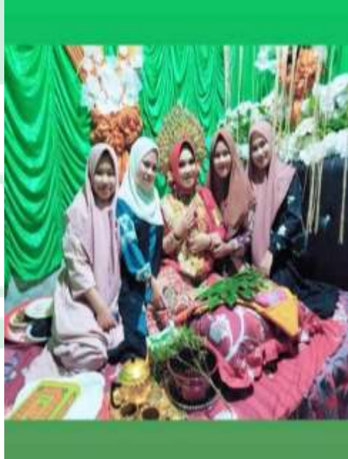
Gambar 2 : Bapak imam desa melaksanakan tradisi mappacing kepada mempelai perempuan