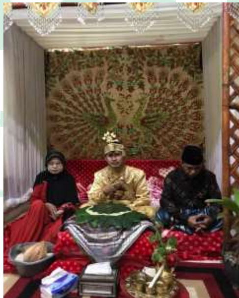
Gambar 4: Proses tradisi mappacing yang dilaksanakan di kediaman mempelai laki-laki