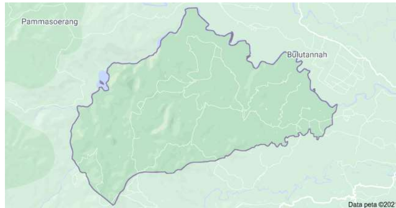
Gambar 4.2 Peta Wilayah Kecamatan Bulupoddo

Memiliki luas daerah 99,47 km 2 dengan populasi penduduk sebanyak 16.017 jiwa pada tahun 2018.