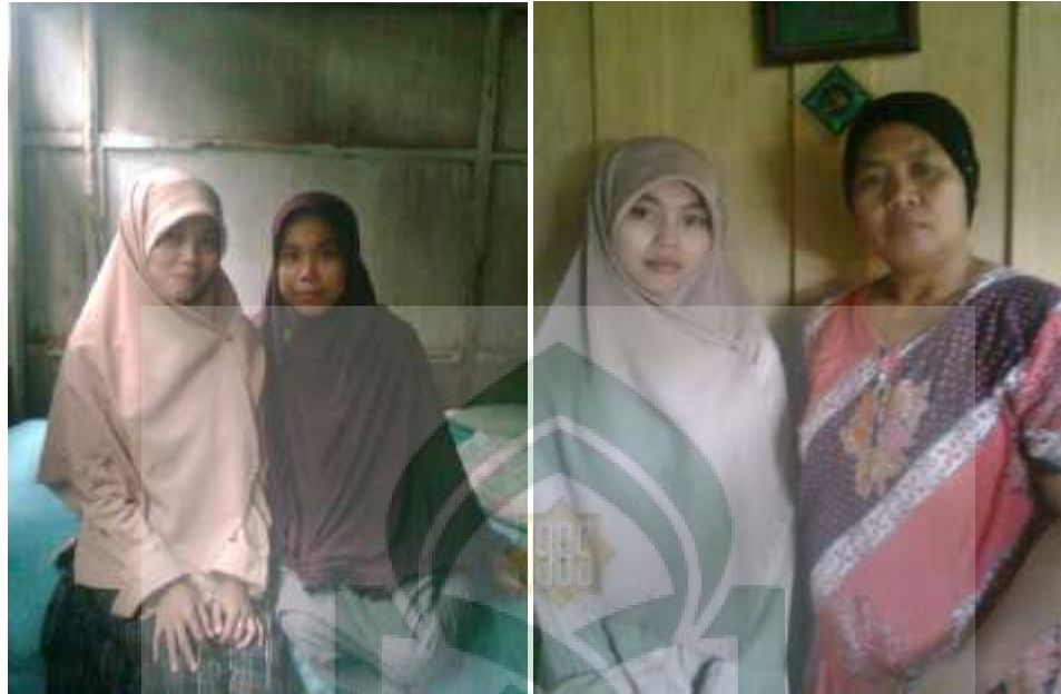
Foto Hajriati dan Barliang bersama penulis se usai wawancara, Lattekko, 18 Oktober 2013.