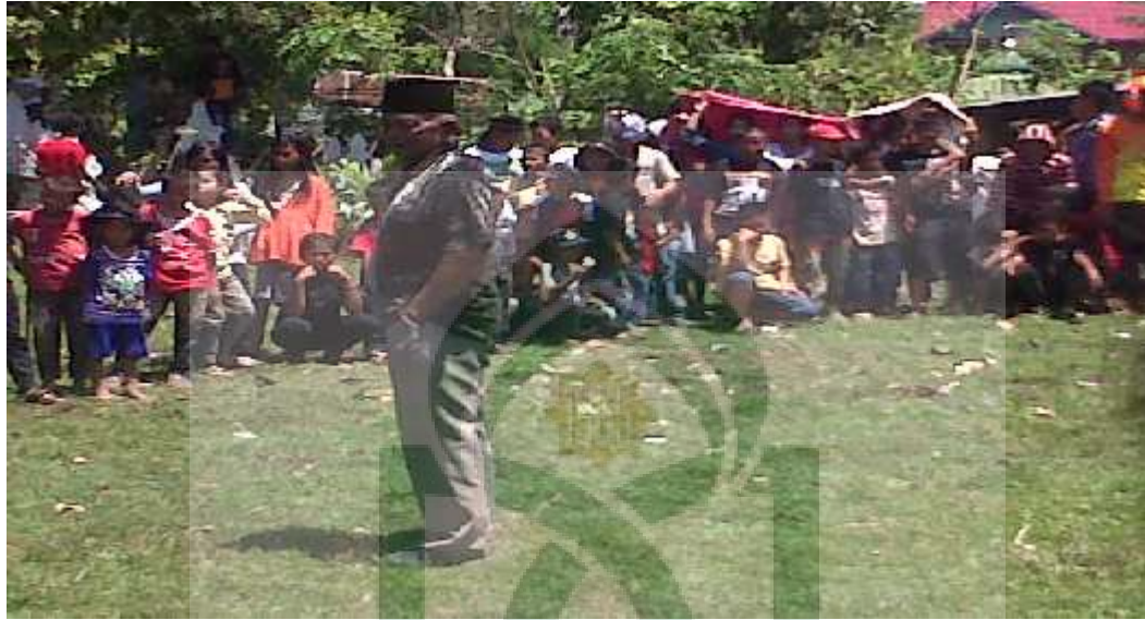
Tradisi Mappasempe, di dusun Takkalu desa Lattekkko, 22 september 2013.