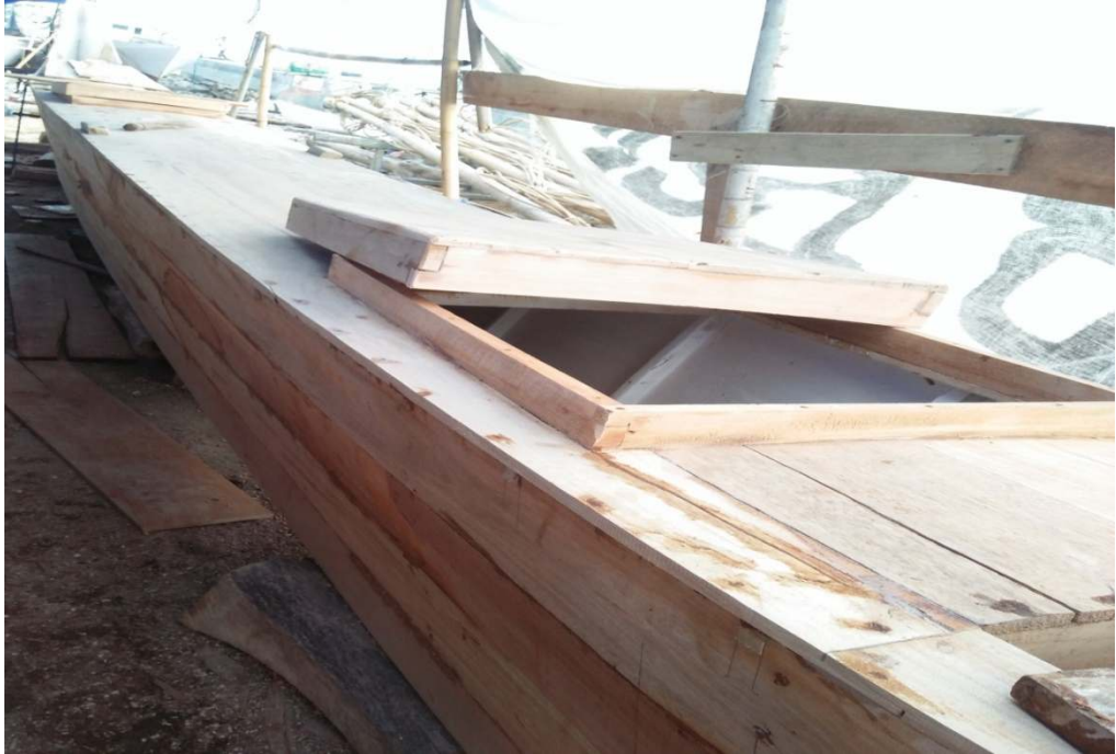
Gambar 5 lopi sandeq