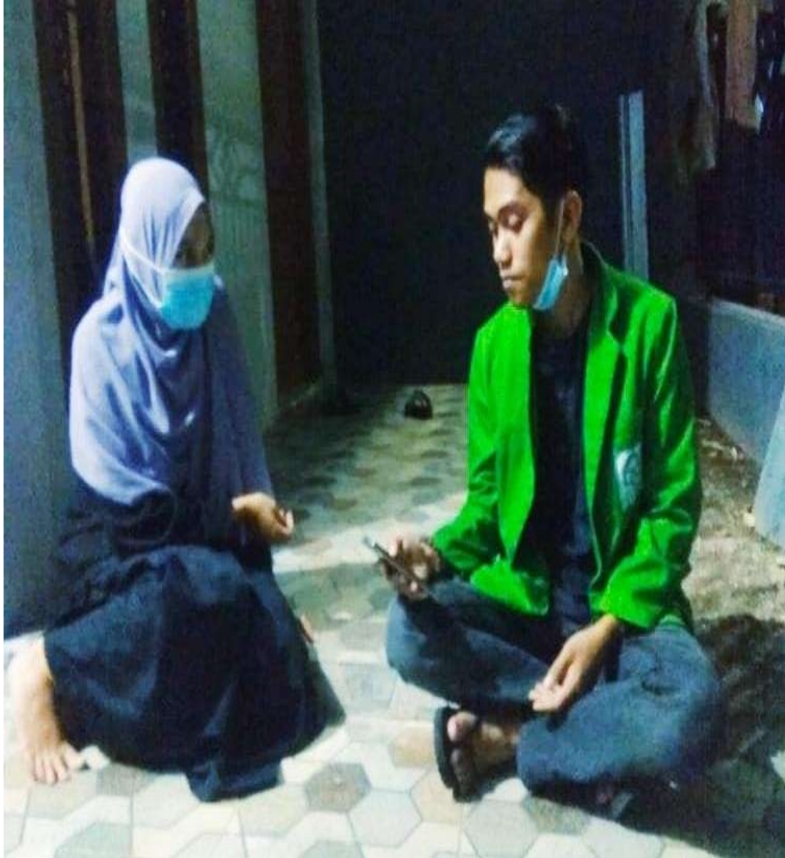
Wawancara bersama waketum KAMMI mengenai toleransi dan kebhinnekaanbertempat di jalan Sudiang pada tanggal 7 Februari 2021