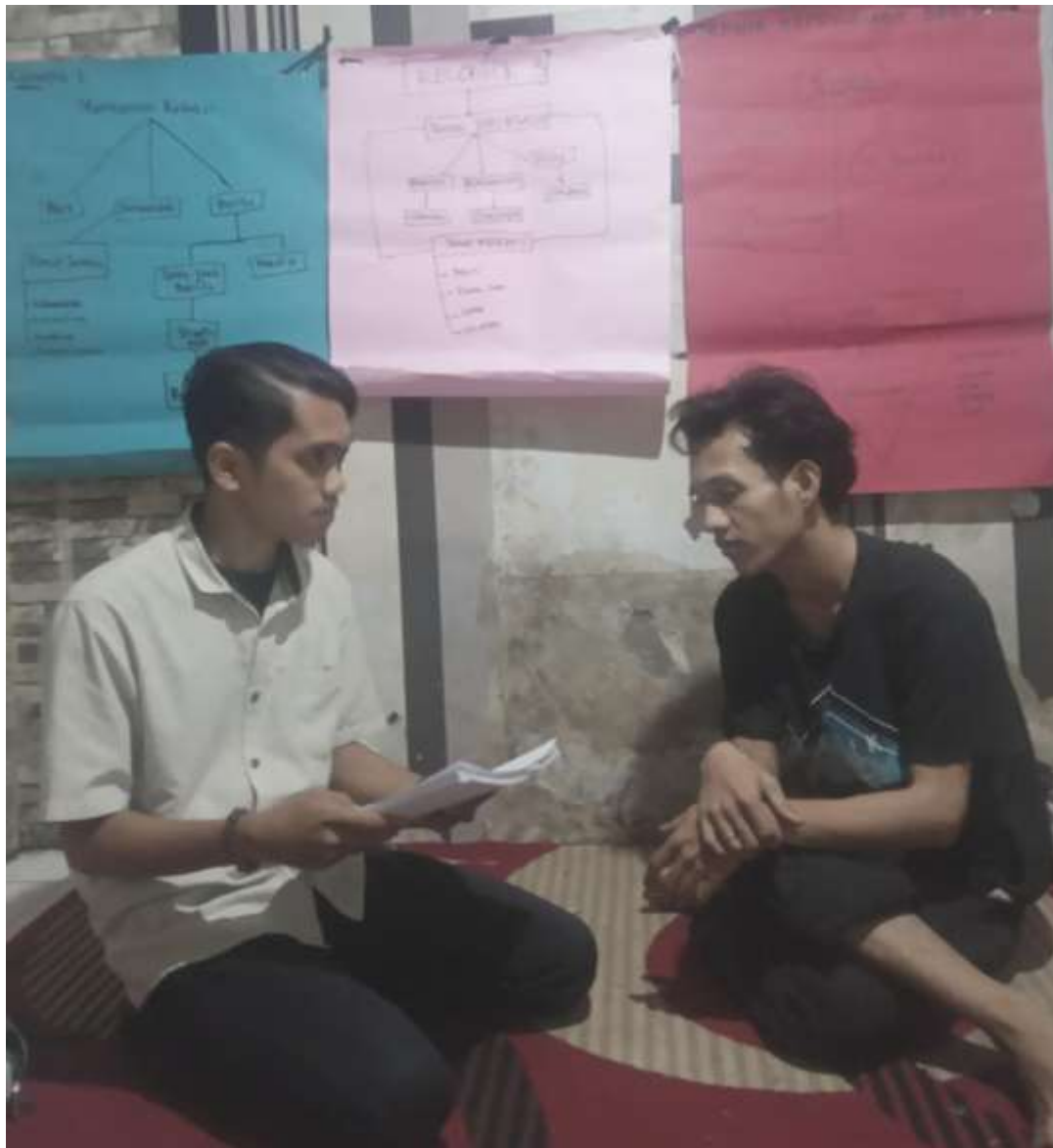
Deni Ketua HMI Komisariat ushuluddin wawancara mengenai Toleransi dan kebhinnekaan, Tempat secretariat HMI UIN Perumahan citra lestari permai padatanggal 10 febuari 2021.