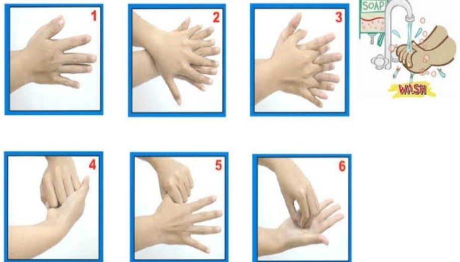
M A K A S A R Gambar 2.2

Cara yang tepat untuk mencuci tangan adalah sebagai berikut :