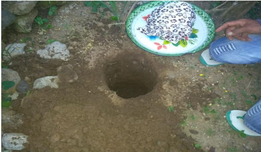
(Bersiap menanam atau menguburkan erung yang dilakukan oleh ayah bayi)