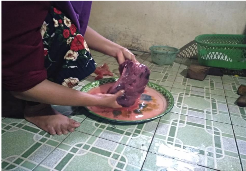
(Proses pembersihan erung bayi tahap kedua)