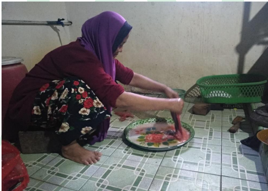
(Proses pembersihan erung bayi tahap pertama oleh nenek bayi)