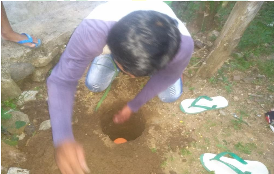
(Proses penimbunan kuburan erung bayi dengan tanah)