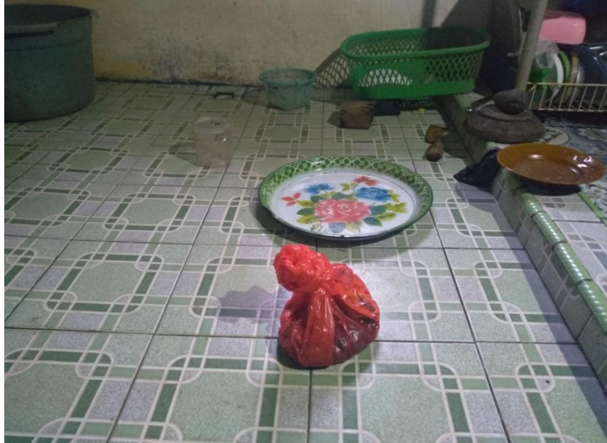
( Erung bayi siap untuk di bersihkan)