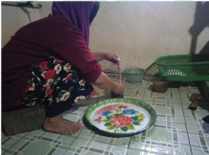
(Memasukkan erung bayi ke dalam wadah, masyarakat menggunakan toples)