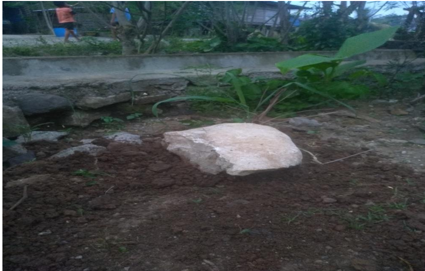
(Menaruh batu berukuran besar di atas kuburan erung bayi)