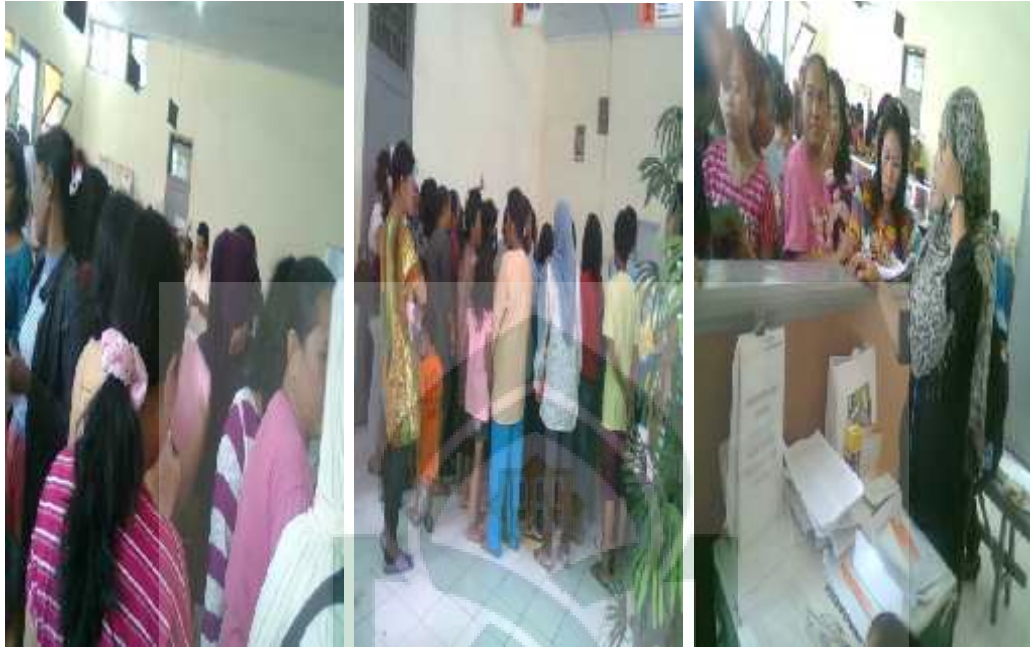
Pada saat pembagian kartu Program Keluarga Harapan kepada peserta penerima bantuan