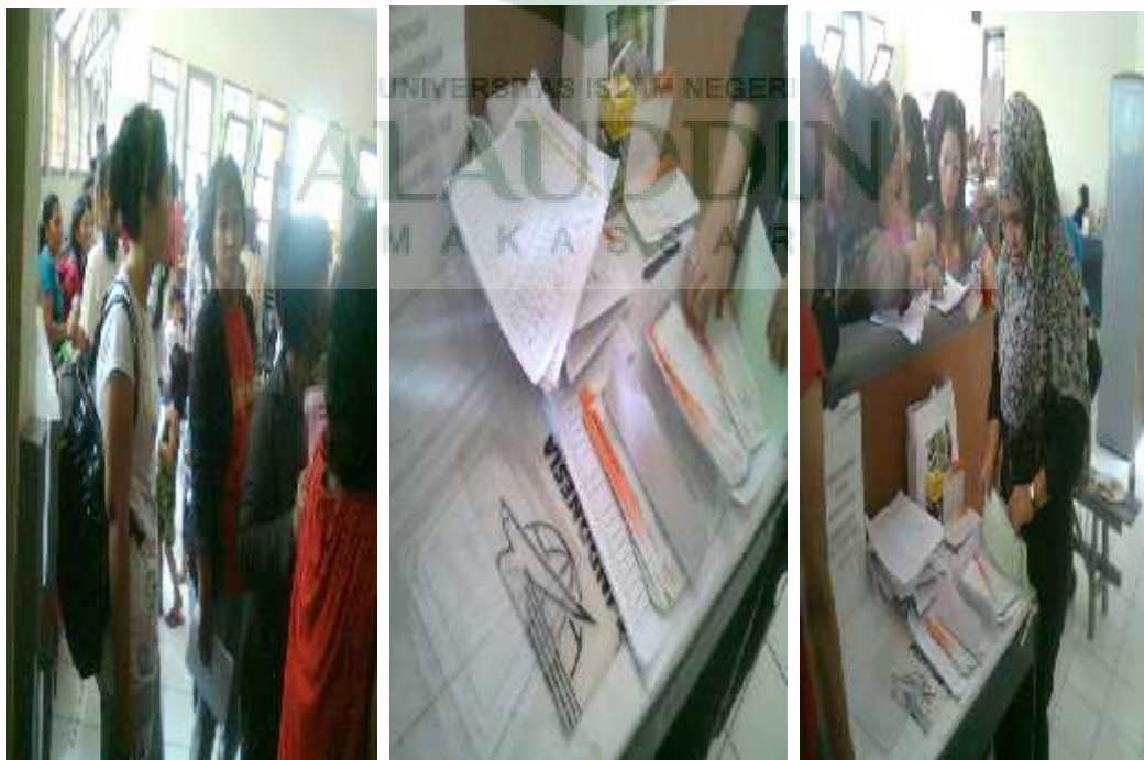
Penyebutan nama serta tanda tangan bagi yang selesai mengambil kartu penerimaan Program Keluarga Harapan