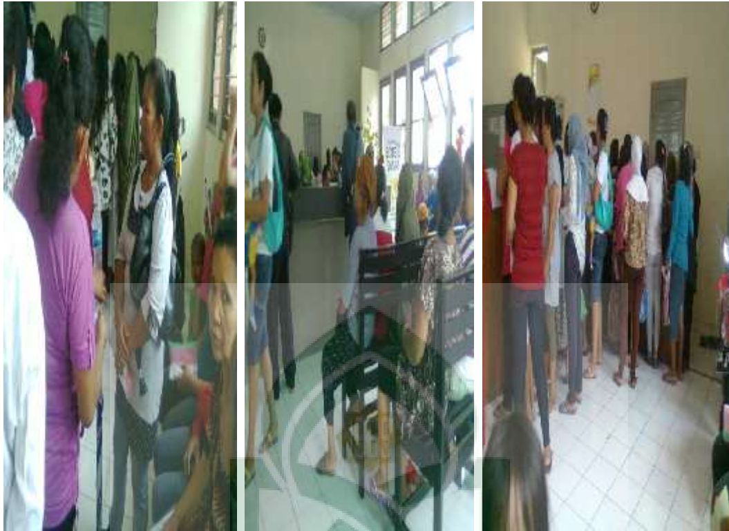
Antrian yg dilakukan oleh peserta Program Keluarga Harapan bagi yang belum disebut namanya