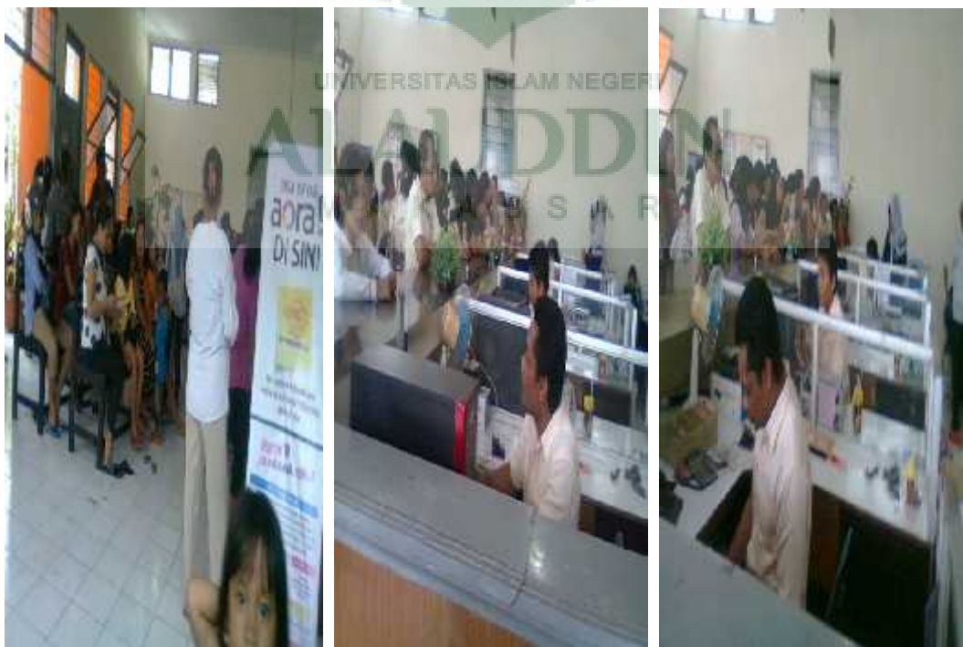
Pengantrian pada saat penyetoran kartu serta pengambilan uang bagi peserta Program Keluarga Harapan.