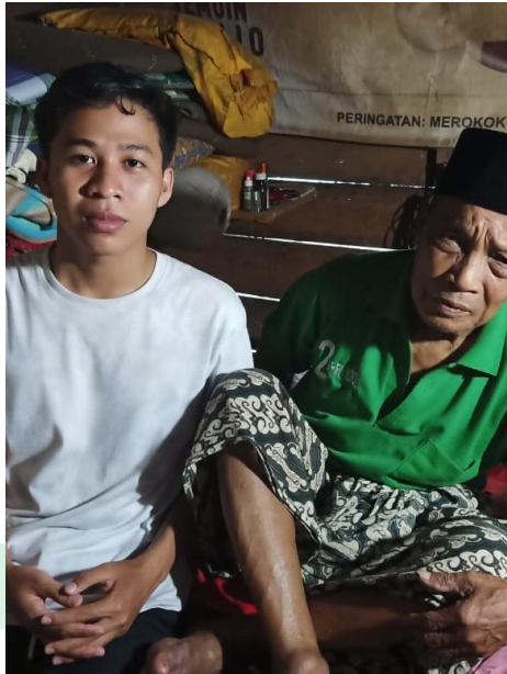
Foto Bersama Puang Sidang Kepala Dusun Manyamba Barat sekaligus Tokoh Agama

Foto Setelah Wawancara dengan Puang Buttu Imam Masjid Baitul Gufran Manyamba.