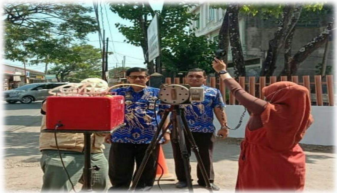
Sampel 5 : Pemeriksaan kadar udara di Kelurahan Sungguminasa