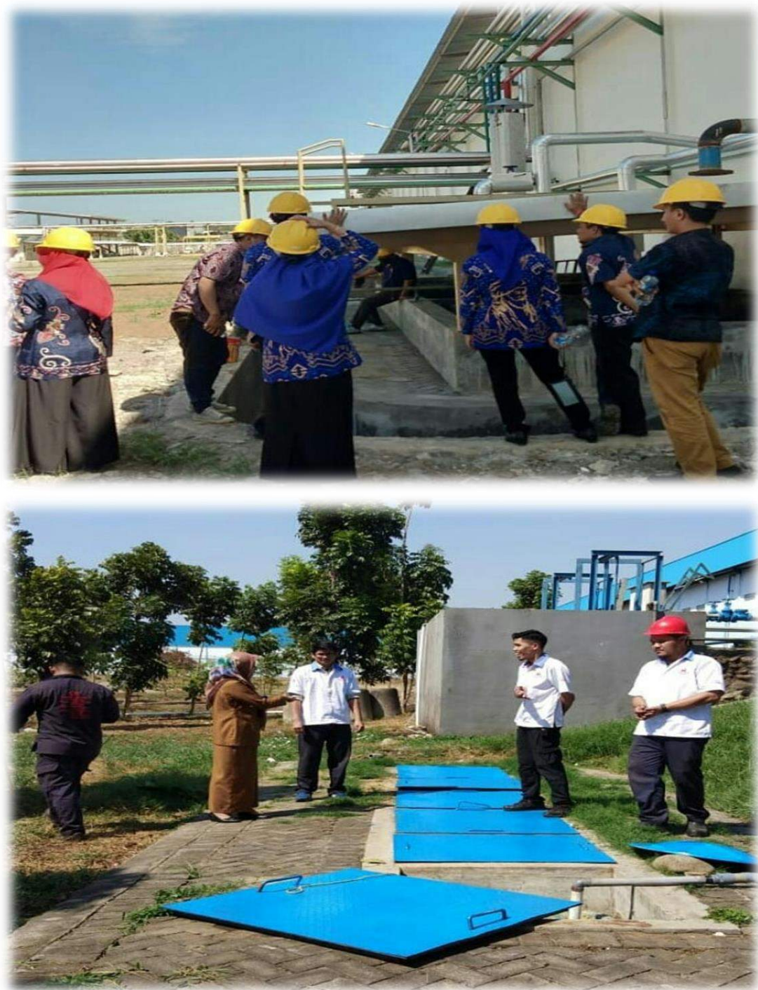
Sampel 4 : Pemeriksaan Limbah pada salah satu perusahaan