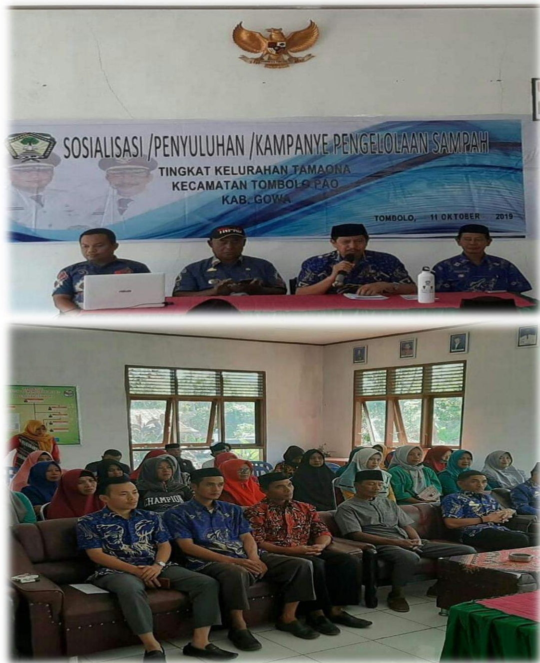
Sampel 1 : Penyuluhan Tingkat Kelurahan Dinas Lingkungan Hidup