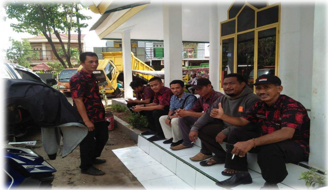
Dokumentasi 3 : Wawancara Peneliti Bersama Informan dan Observasi bersama Pelaksana Pembimbing Pencegahan Pencemaran Lingkungan