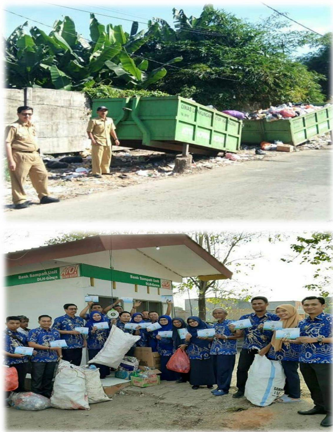
Sampel 6 : Survei Lokasi dan Penimbangan Sampah