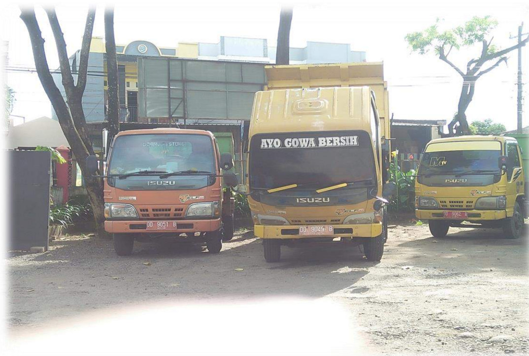
Dokumentasi 1 : Kantor Dinas Lingkungan Hidup Kab. Gowa