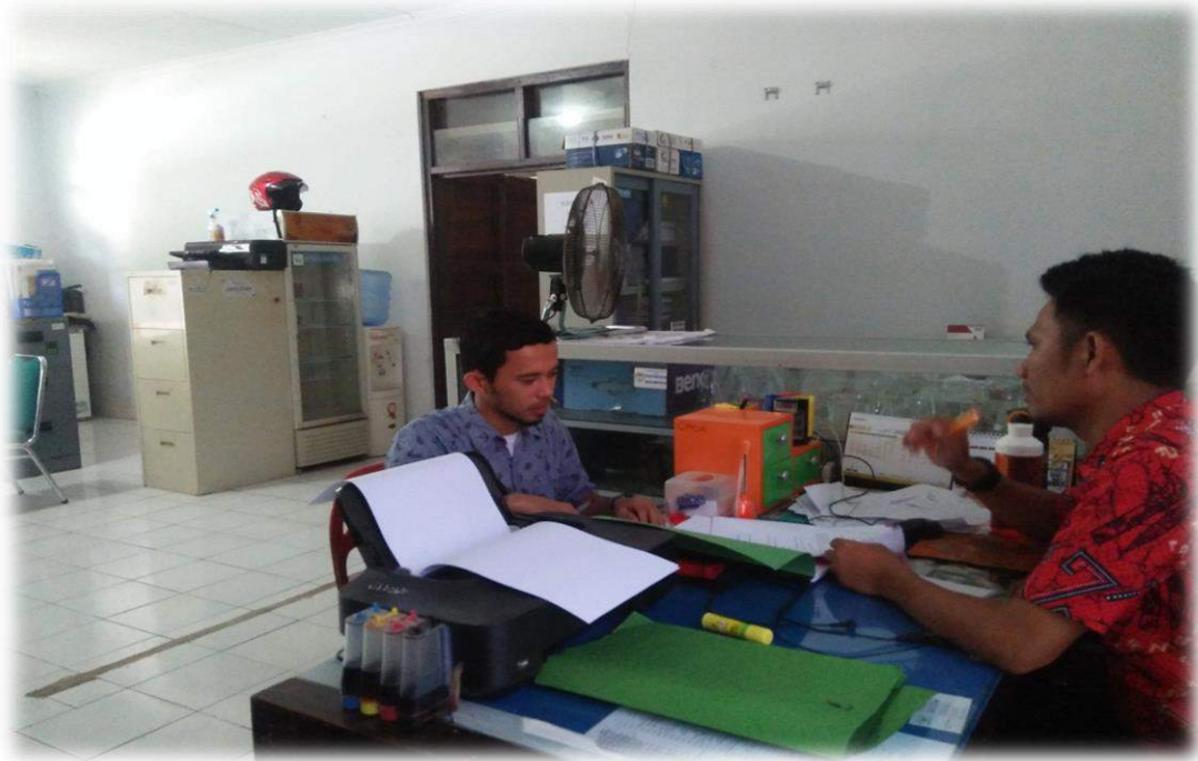
Dokumentasi 2 : Wawancara Peneliti Bersama Informan