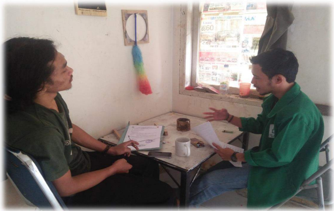
Dokumentasi 4 : Peneliti bersama informan