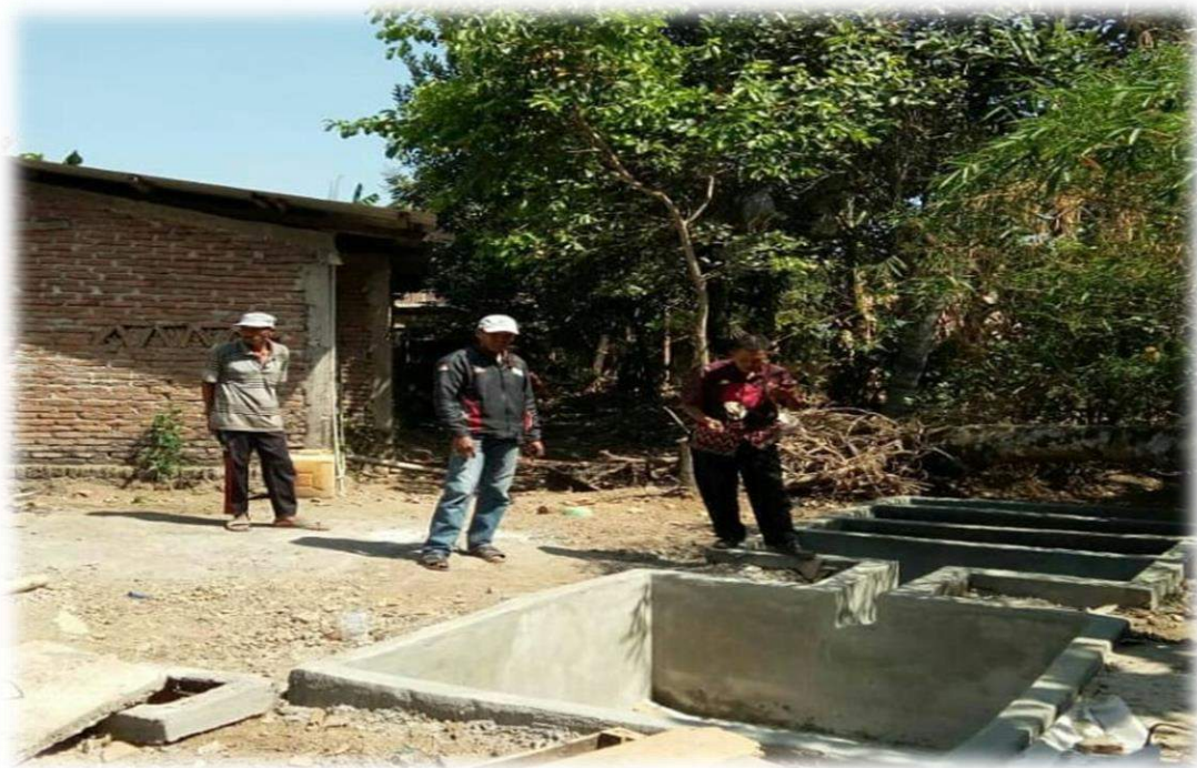
Sampel 2 : Bimbingan Pembuatan Pembuangan Limbah pada salah satu perusahaan