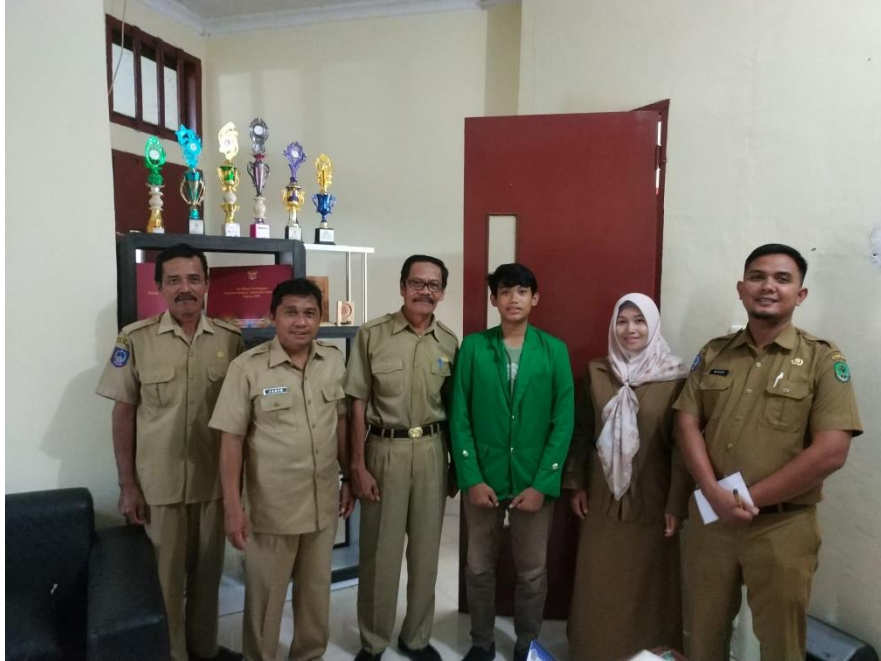
Kantor Dinas Kebudayaan dan Pariwisata Kabupaten Luwu Uatar