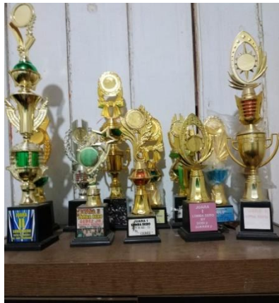
Gambar 7 : piala perlombaan tarian Dero

“Saya tertarik dengan tarian Dero ini karena menyehatkan tubuh dan Dero juga ada ajang perlombaan antar komunitas Dero sehingga membuat saya antusias melakukan tarian Dero ini supaya bisa menang dalam lomba tersebut”. 65