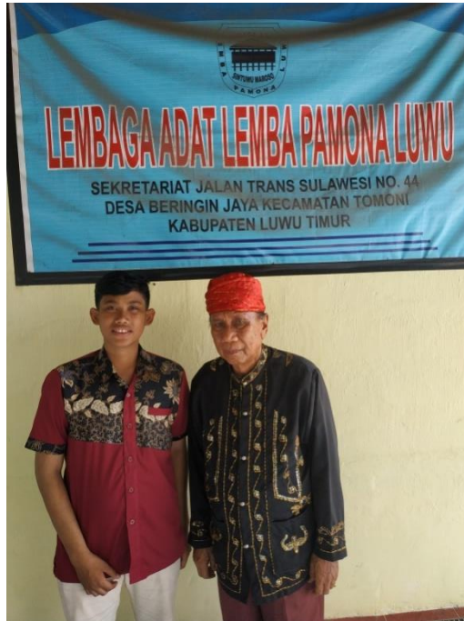
Wawancara dengan Bapak Piliat