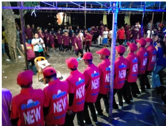
Gambar 6 :Dero menjadi hiburan masyarakat Sumber (gambar pemnulis)

Saat ini pemerintah dan aparat tidak lagi memberi izin keramaian jika keramaian itu berkaitan dengan tarian Dero, karena aparat kepolisian menyadari bahwa remaja dan masyarakat yang melakukan tarian Dero banyak mengonsumsi obat-obatan dan hal yang bisa berakibat fatal terhadap masyarakat Kelurahan Bone Tua Kabupaten Luwu Utara.