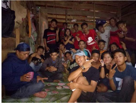
Gambar 2 : silaturahmi antar penari Dero Sumber (gambar penulis)

Menurut hasil wawancara di atas menjelaskan bahwa tarian Dero adalah tarian yang sederhana semua orang bisa melakukan tarian Dero ini walau beda agama, ras dan budaya sehingga masyarakat bisa menjalin silaturahmi tanpa memandang dia kaya atau miskin.