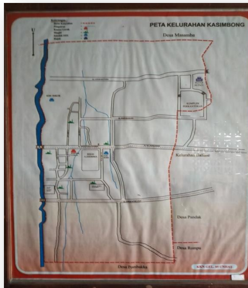
Gambar 1: Peta Kelurahan Bone Tua

Secara administratif wilayah kelurahan Bone Tua merupakan wilayah Kelurahan perkotaan, pertanian, dan perkebunan yang terdiri dari 6 (enam) lingkungan. Secara umum, tipologi Kelurahan Bone Tua terdiri dari persawahan dan perkebunan. Berikut peta Kelurahan Bone Tua/Kasimbong: