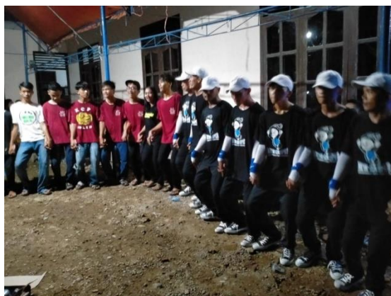
Gambar 5: Penari Dero

Informan Ilham juga mendukung adanya Tarian Dero di Kelurahan Bone Tua Kabupaten Luwu Utara yang mengatakan: