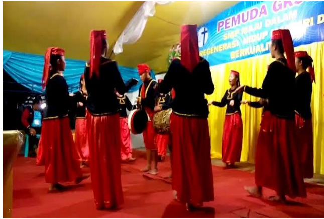
Gambar 4 :Penari Dero wanita

itu artinya cintanya ditolak. Itulah bentuk mengungkapkan rasa cinta dengan sederhana lewat sebuah tarian”. 53