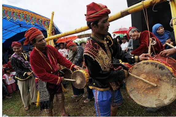
Gambar 3: pengiring musik tarian Dero

si pemain gendang, gerakan tarian Dero bergerak sesuai nada si pengiring dan lagu si penyanyi atau si penari tersebut”. 52