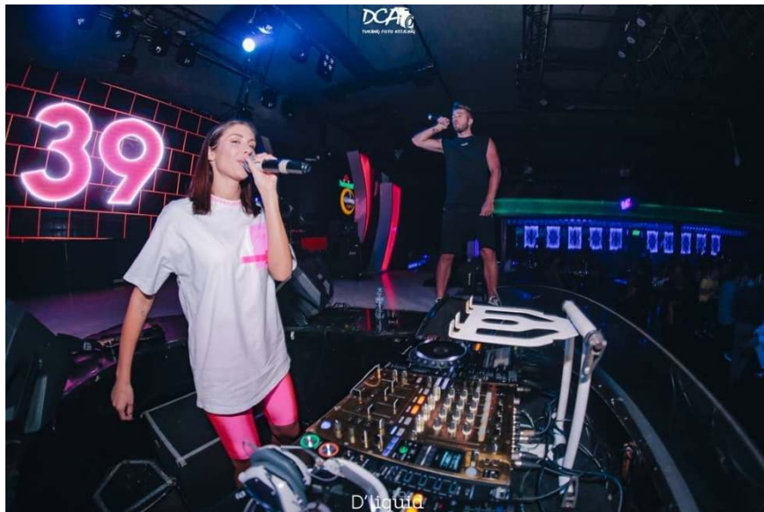
Dokumentasi 8 . Halloween Party D'Liquid Makassar