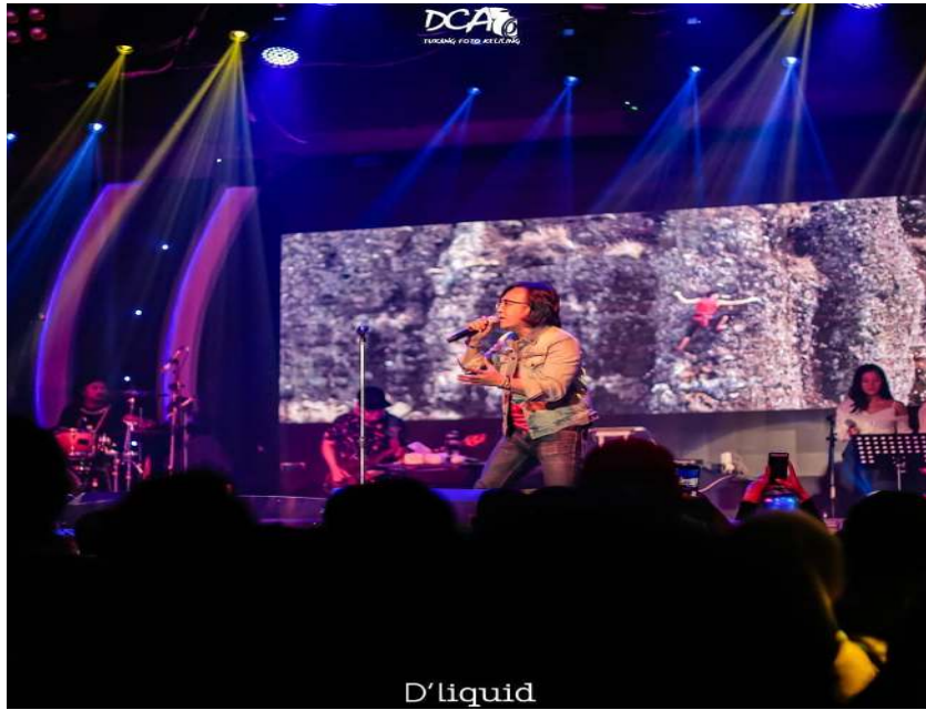
Dokumentasi 7 . Live Concert Ari Lasso D'Liquid Makassar