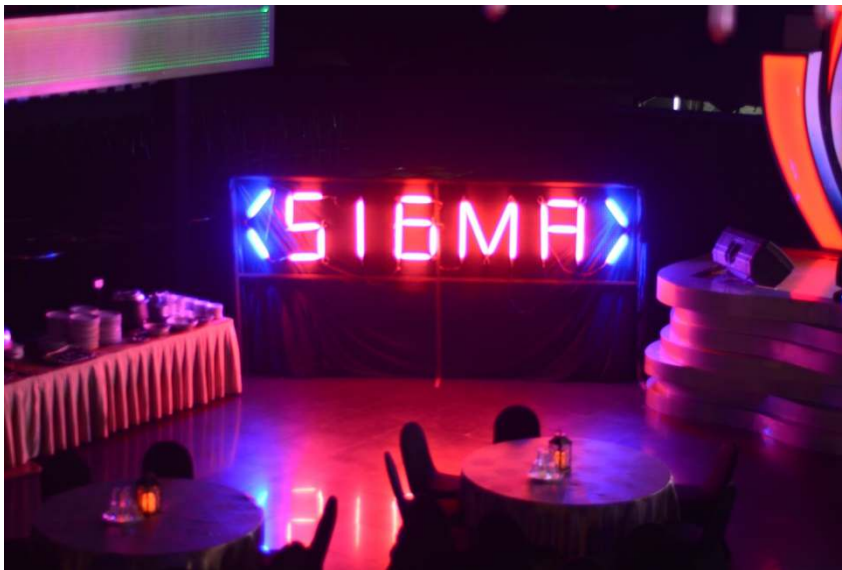
Dokumentasi 6 . Acara Gathering Sekolah