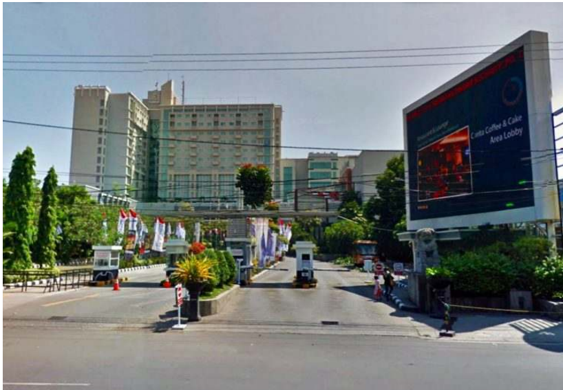
Gambar 4.4 Area Papan Iklan Hotel Claro

Media cetak adalah sarana komunikasi secara tertulis yang memuat berbagai informasi teks dan juga gambar. Informasi yang disampaikan melalui media cetak adalah satu cara yang tergolong sudah lama, akan tetapi informasi yang disampaikan oleh media cetak dapat langsung dilihat oleh masyarakat umum tanpa harus memiliki akun media sosial atau mengakses internet. Informasi mengenai D'Liquid dapat dilihat di papan iklan yang berada di depan Hotel Claro Makassar.