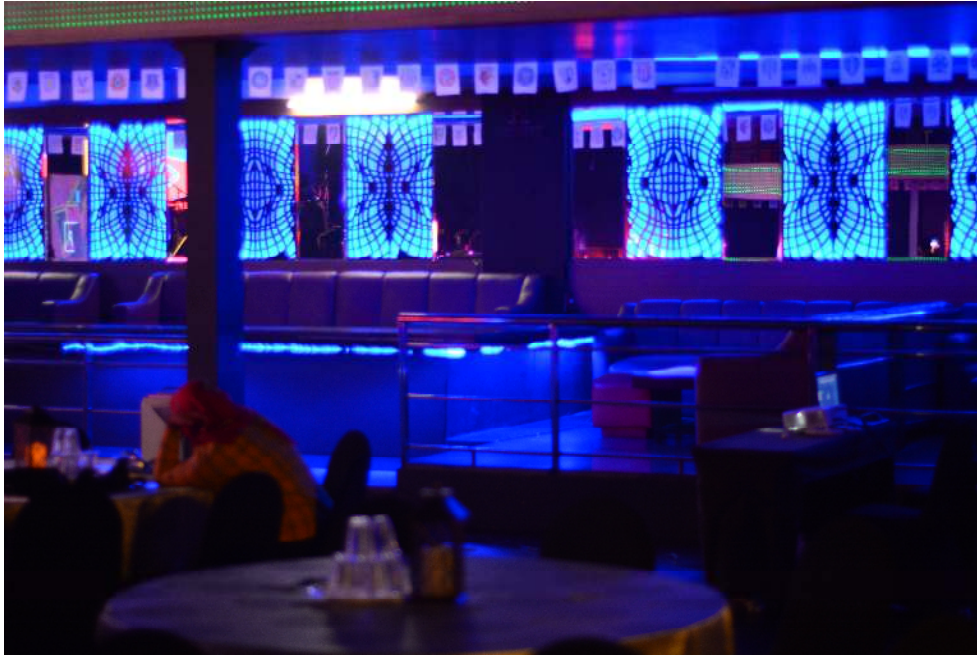
Dokumentasi 5 . Area Bar and Café D’Liquid