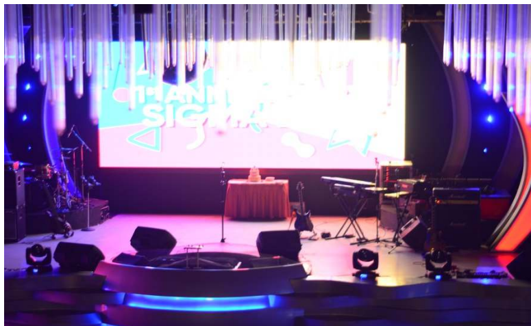
Gambar 4. 1 Area Panggung D'Liquid

D'Liquid memiliki salah satu panggung yang tergolong besar yang dapat mencakup performer lebih dari 10 orang , seperti berikut: