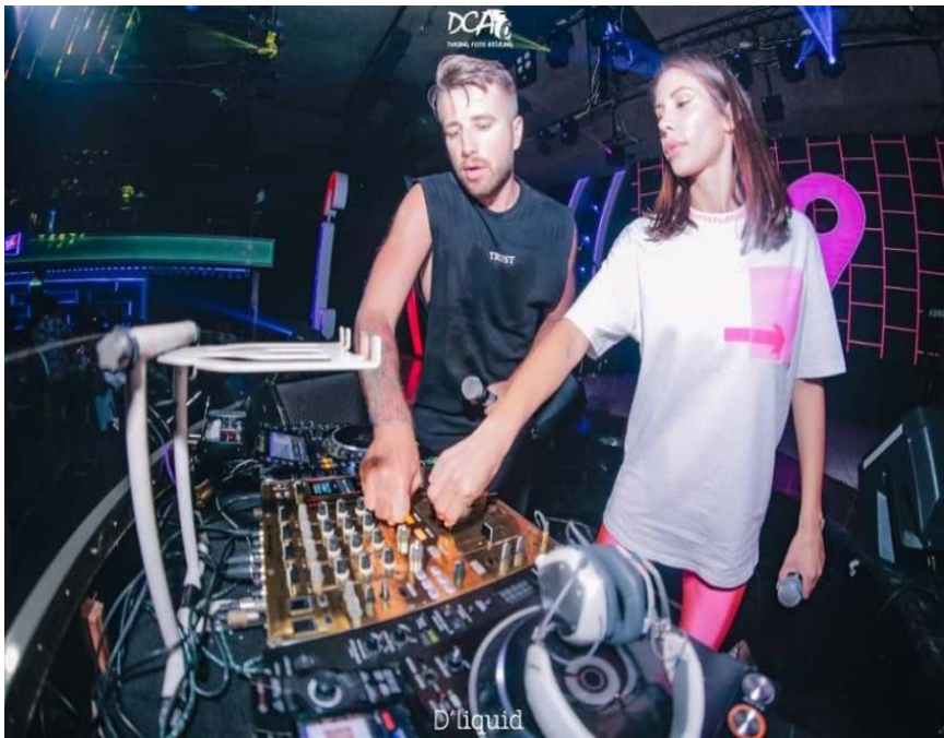
Gambar 4.3 Halloween Party D’Liquid

D’Liquid juga menerapkan sebuah ide atau tema yang berbeda beda dalam setiap moment tertentu, seperti halnya event yang telah di gelar yang bertepatan dengan perayaan Halloween. Pihak D’Liquid melihat hal ini sebagai suatu inovasi sehingga membuat event yang bertemakan Halloween Party yang mendatangkan performer asing dari Rusia yang membuat event ini semakin menarik.