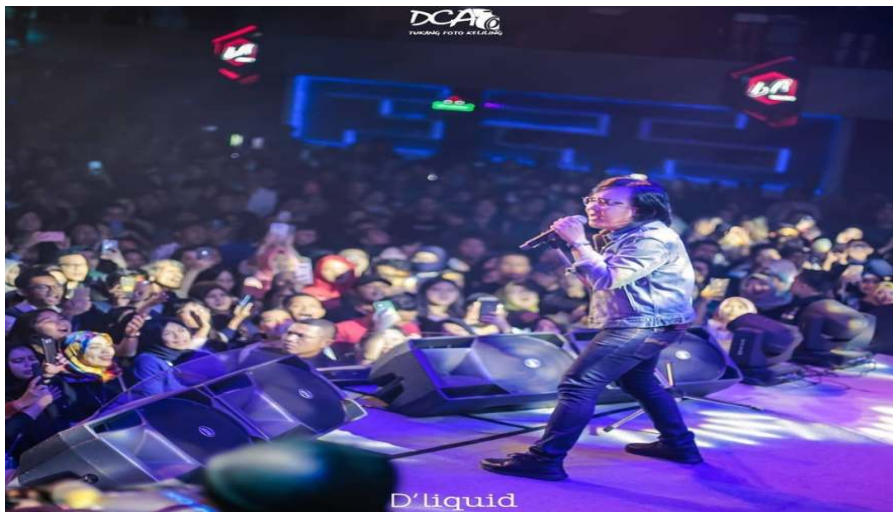
Gambar 4.2 Live Concert Ari Lasso D’Liquid

“Menurut saya harga sebuah tiket yang diberikan untuk dapat menyaksikan live music dari Ari Lasso tergolong sangat wajar. Hal ini karena melihat dari fasilitas-fasilitas yang ada disana terbilang sangat lengkap dan juga memberikan rasa nyaman saat konser berlangsung. Hal ini tentu saja membuat seluruh pengunjung disana merasa nyaman dan terhibur oleh live music dan pelayanan yang disajikan. Untuk keamanan juga boleh dikatakan sangat baik karena D’Liquid memiliki petugas keamanan berjumlah empat orang.” 5