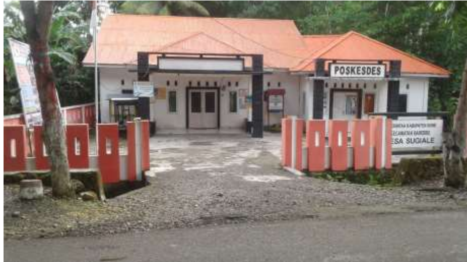
Kantor Desa Sugiale Kecamatan Barebbo Kabupaten Bone