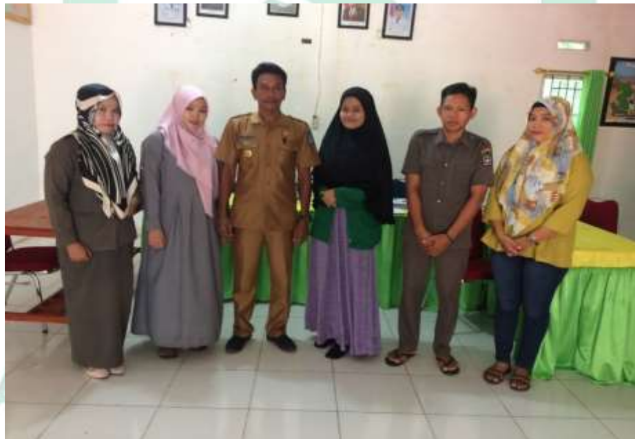
Foto bersama Kepala Desa Sugiale dan Staf Kantor Desa Sugiale