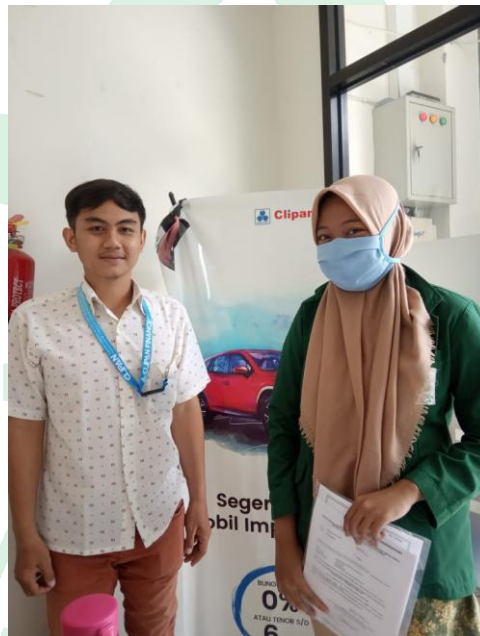
PT Clipan Finance