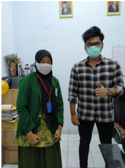
PT Astra Credit Companies (ACC)