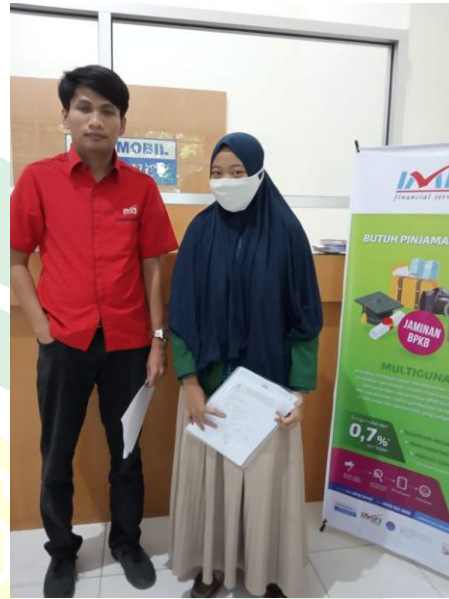
PT Indomobile Finance