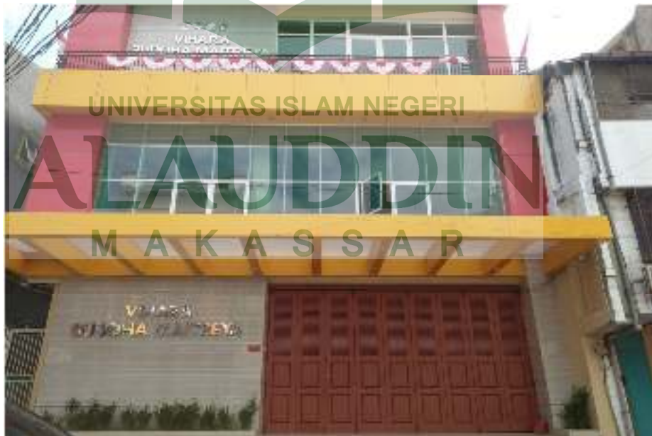
Vihara Buddha Maitreya, 07 Agustus 2017