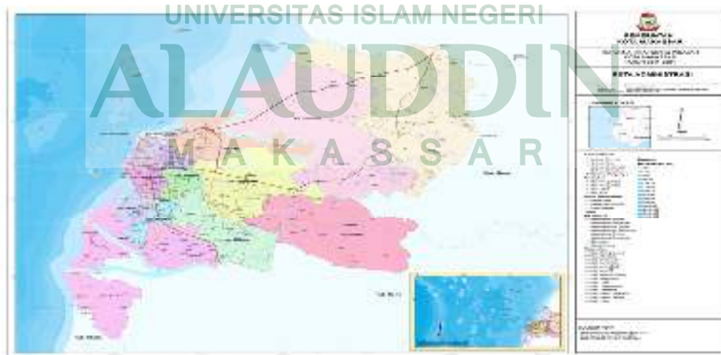
Gambar : Peta Administrasi Kota Makassar