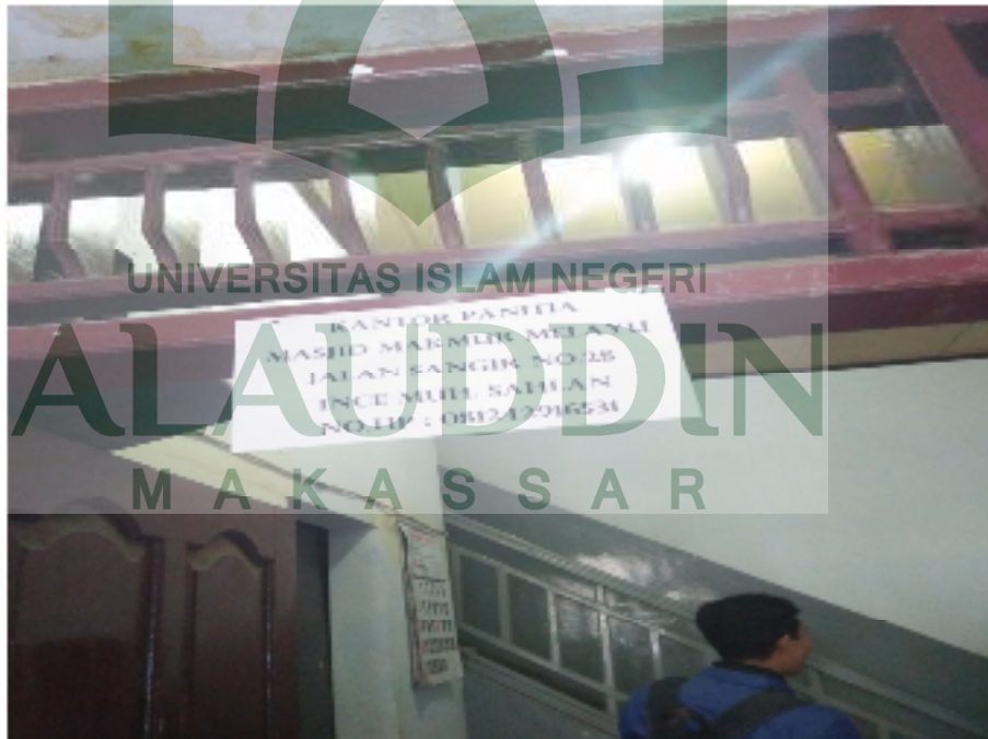
Masjid Makmur Melayu, 07 Agustus 2017