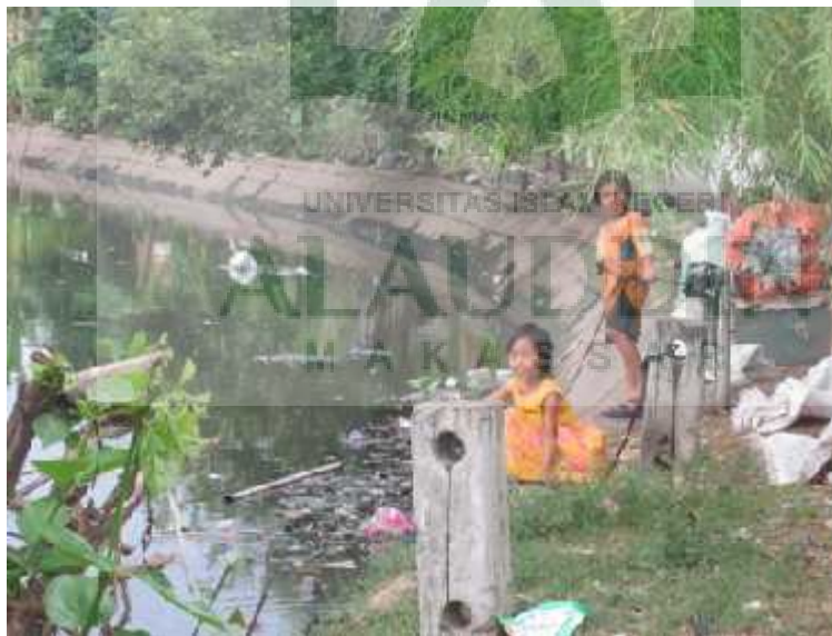
Gambar 3 dan 4. Klien Anak putus sekolah saat didapati sedang bermain sekaligus memulung barang-barang bekas.