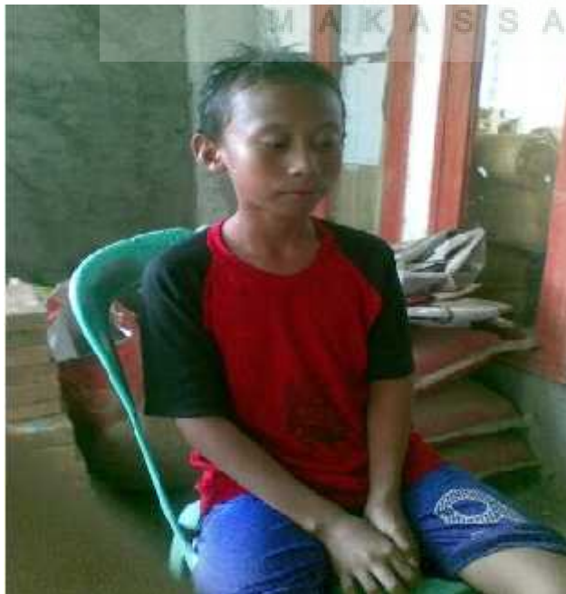
Gambar 2. Salah seorang klien (Anak putus sekolah) saat diwawancarai