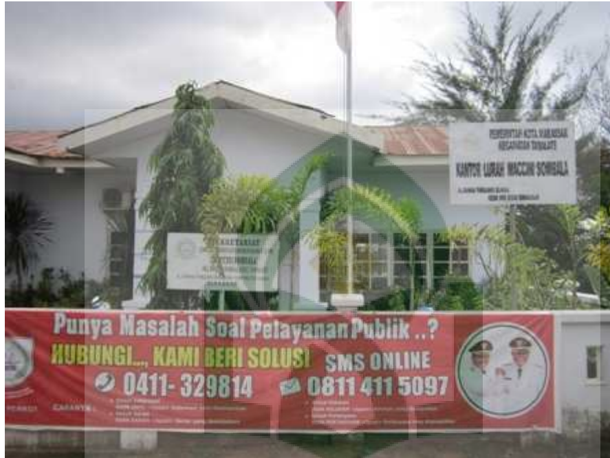
Gambar 1. Kantor Kelurahan Maccini Sombala