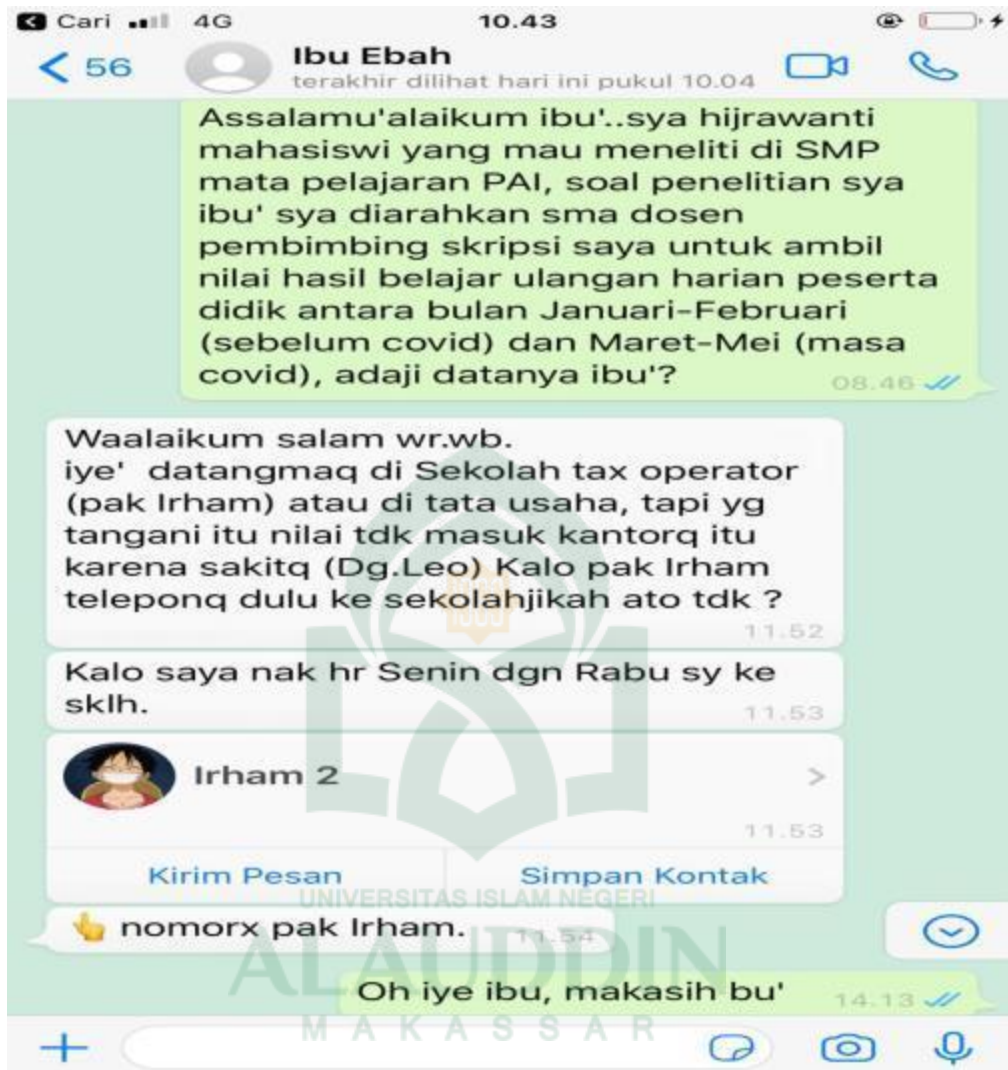
Chat peneliti dengan guru PAI di SMP Negeri 1 Parangloe