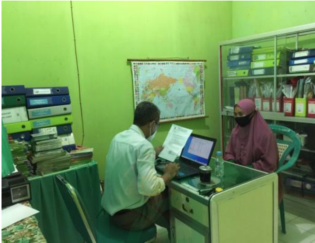
Dokumentasi dengan Wakil Kepala Sekolah SMP Negeri 1 Parangloe