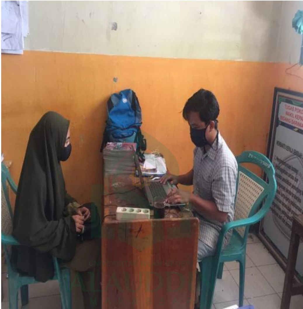
Dokumentasi bersama operator SMP Negeri 1 Parangloe