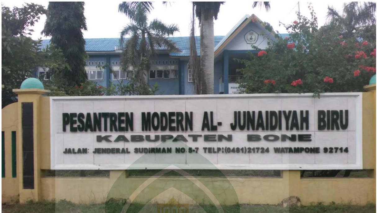
Lokasi Pondok Pesantren Al-Junaidiyah Biru Kab. Bone.