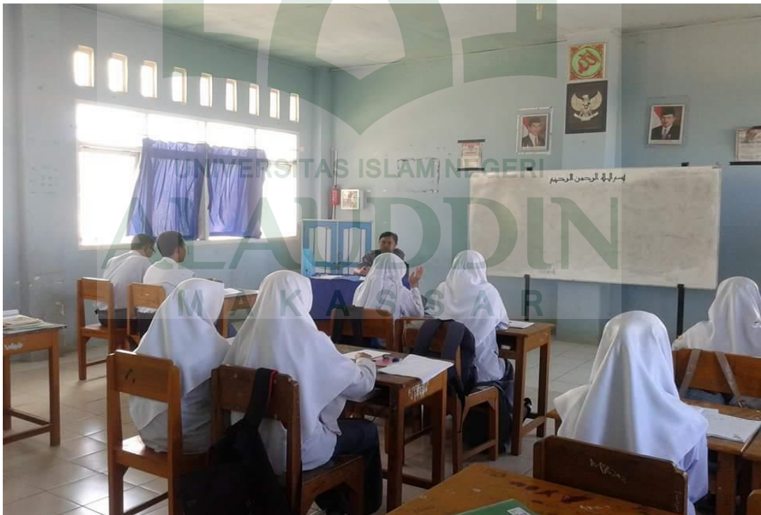
Suasana Pembelajaran dalam kelas di Pesantren Biru Kab. Bone