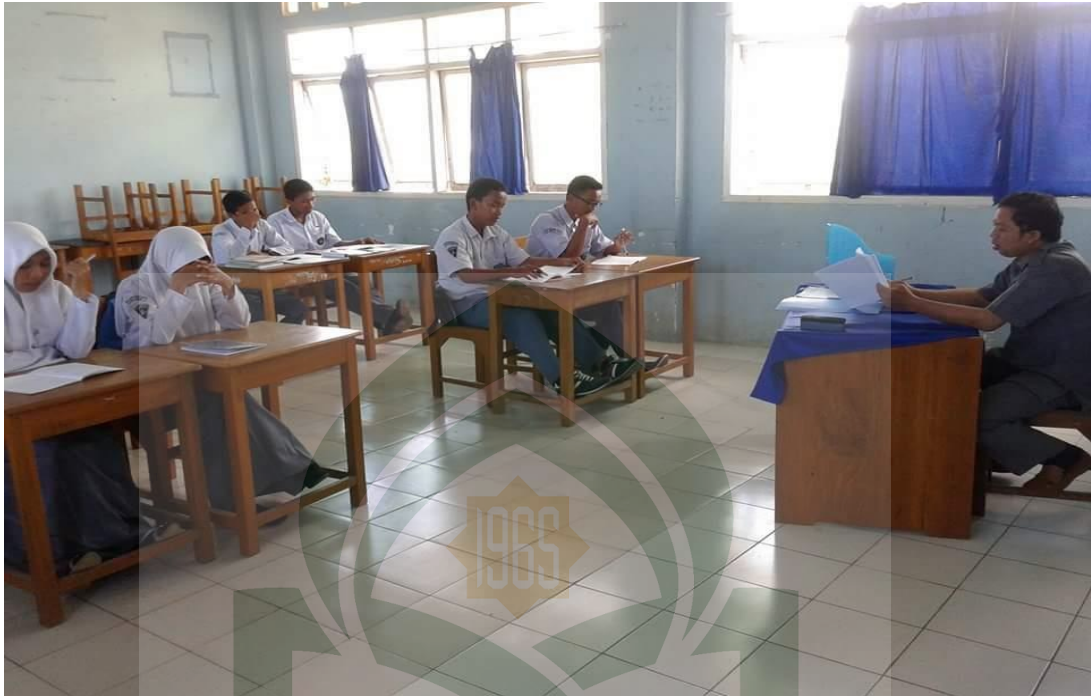
Proses pembelajaran dalam ruangan di Pesantren Al-Junaidiyah Biru Kab. Bone