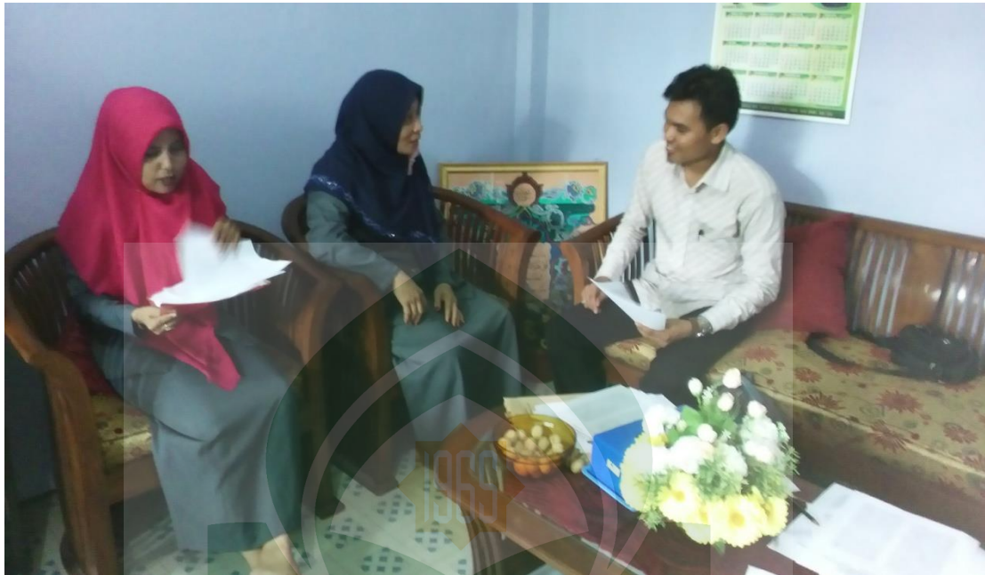
Wawancara Kepala Madrasah dan Wakamad di Ruang kepala Madrasah