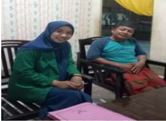
Foto-Foto Wawancara Dengan Para Informan