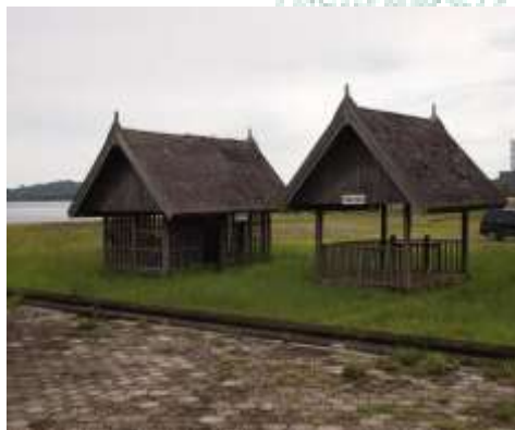
Kandang Rusa Dan Kandang Kuda