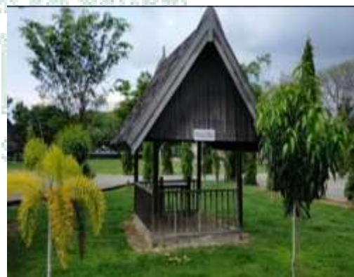
Gubuk Pandai Emas