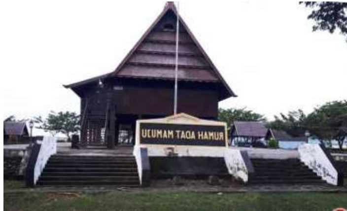
Rumah Adat Sapo Kayyang Mamuju