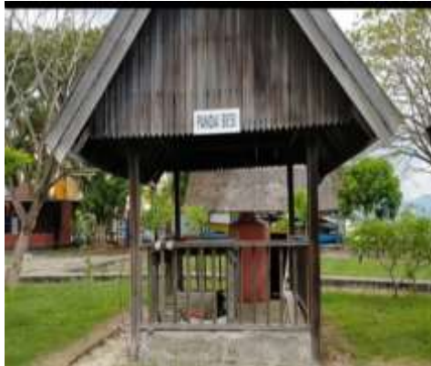
Gubuk Pandai Besi