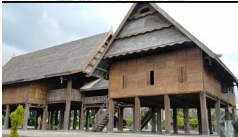
Rumah Raja Disambung Dengan Jembatan Kecil, Rumah Pengawal