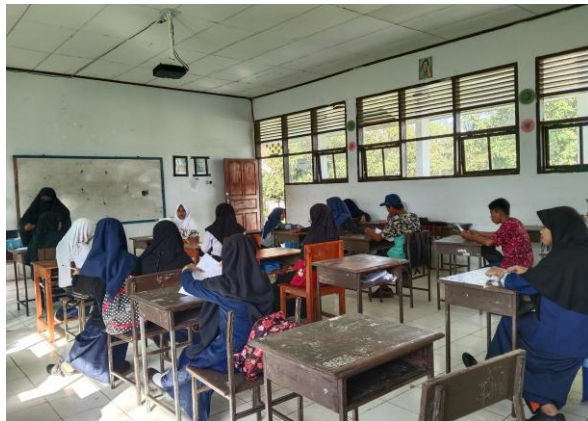
Gambar Peserta Didik saat Pengisian Angket