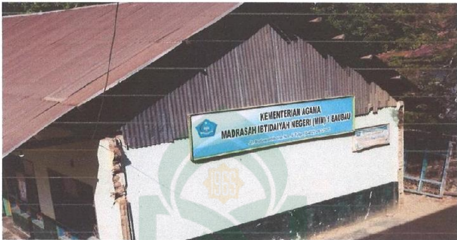
Halaman Depan MIN 1 Bau-Bau