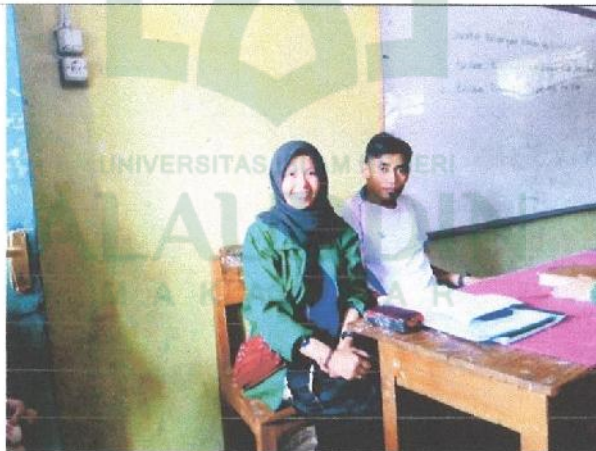
Foto Bersama Guru Setelah Wawancara