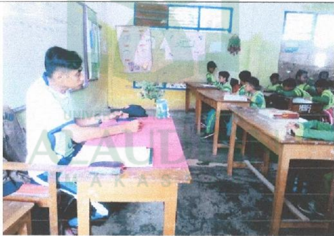
Proses Belajar Mengajar di Kelas