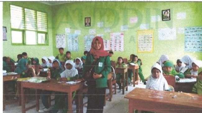
Foto Bersama Guru dan Peserta Didik