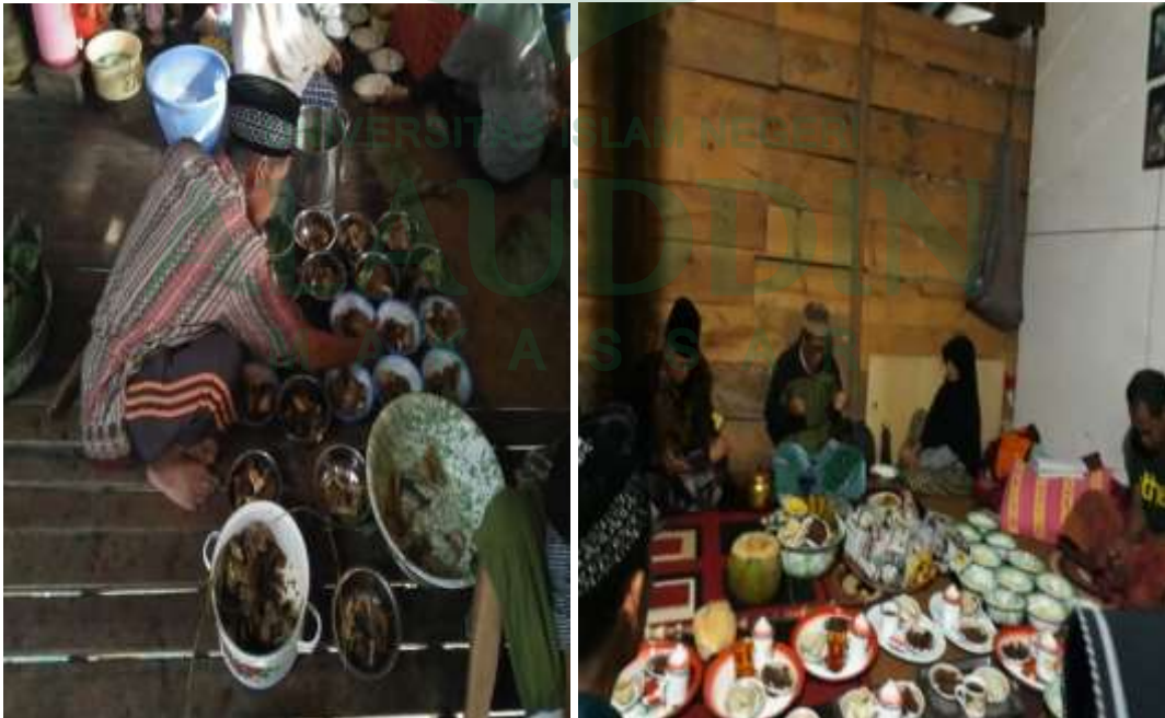
Persiapan dan pembacaan do'a oleh para Guru.