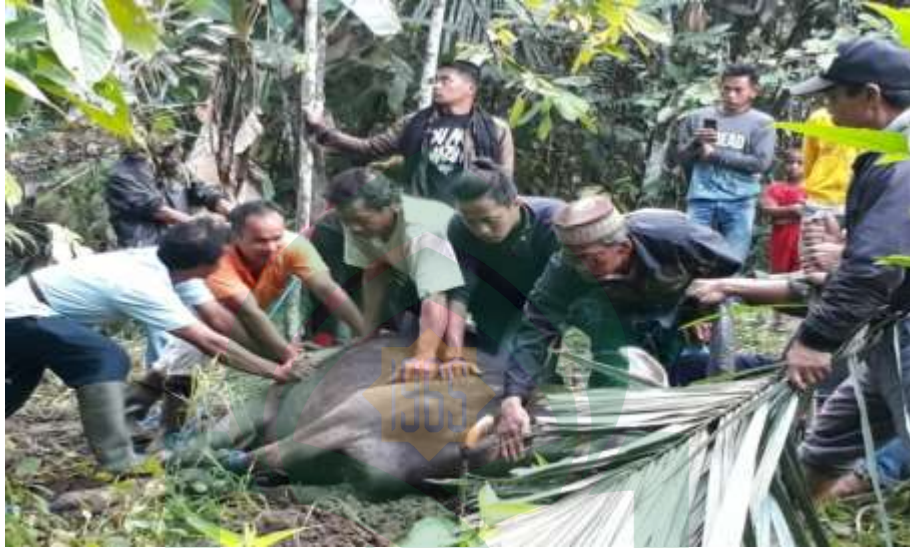
Proses Pematongan Kerbau