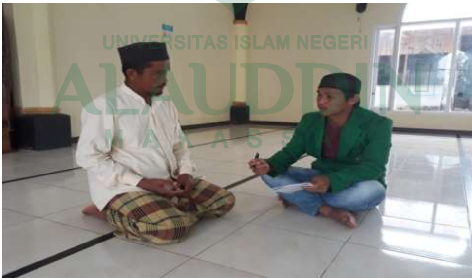
Wawancara dengan Attu, (Imam Masjid)