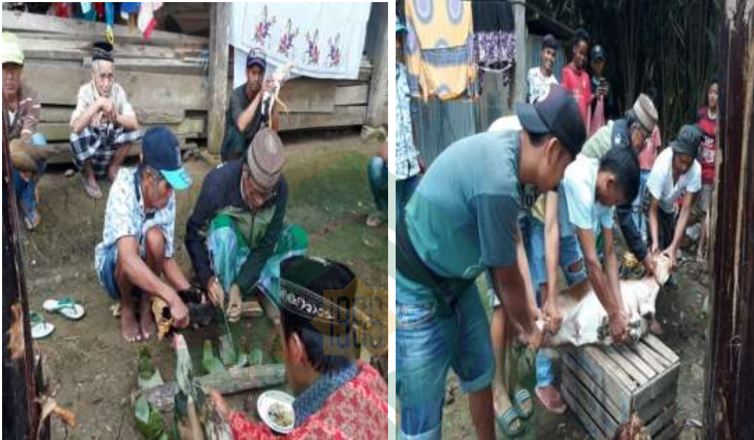
Proses Pematongan Ayam dan Kambing.