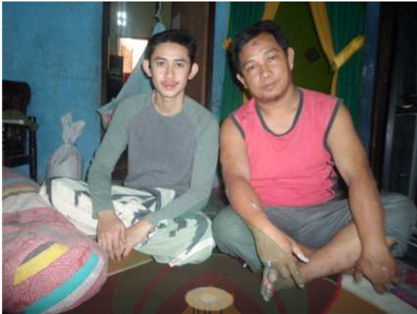
Peneliti bersama Bapak Kepala Desa Rappoa