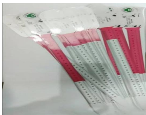
Gambar 2.1. pita LILA