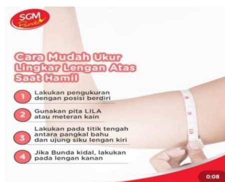
Gambar 2.2 Cara Mengukur LILA