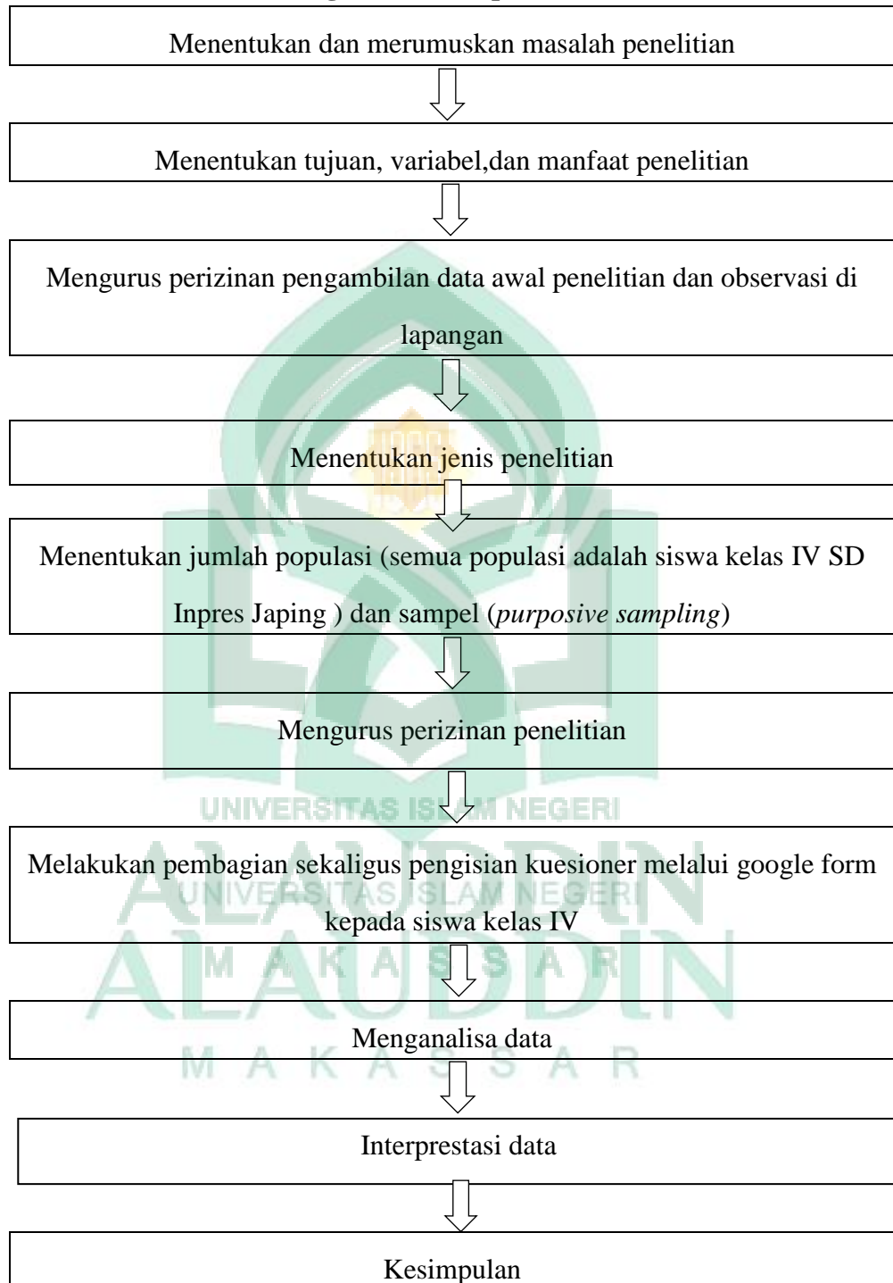
Bagan 2.3 Alur penelitian