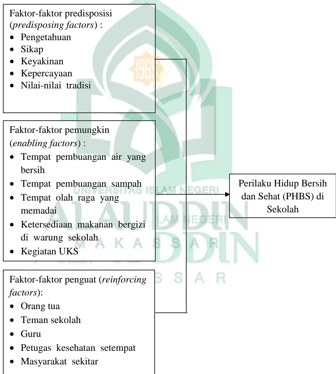
Bagan 2.1 Kerangka Teori

Sumber : Notoatmodjo (2007), (Adiwiryo, 2010)