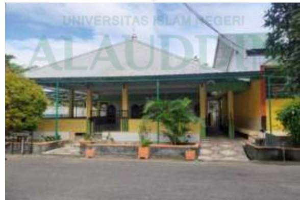
Mushollah SMA Negeri 2 Bantaeng