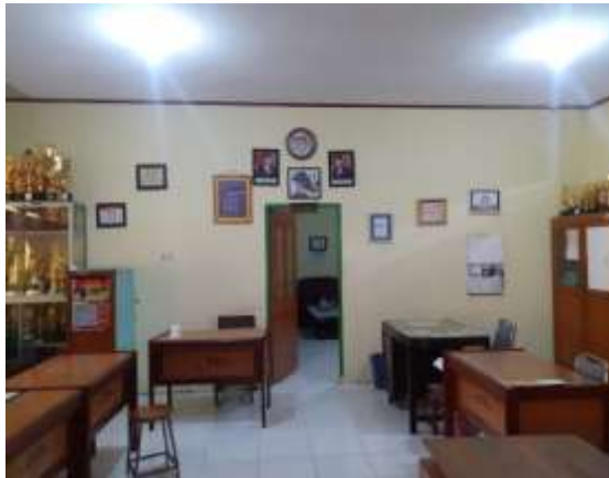
Ruang Kantor SMA Negeri 2 Bantaeng