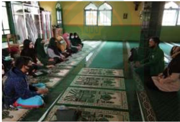
Dokumentasi bersama para peserta didik dan Koordinator Bimbingan Konseling.