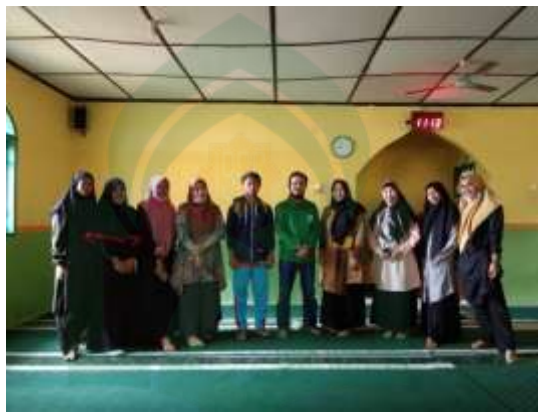
Dokumentasi Bersama peserta didik SMA Negeri 2 Bantaeng