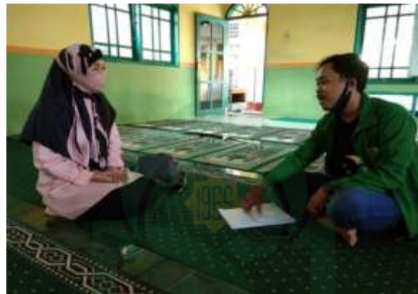
Dokumentasi Bersama Pendidik Bidang Bimbingan Konseling SMA Negeri 2 Bantaeng