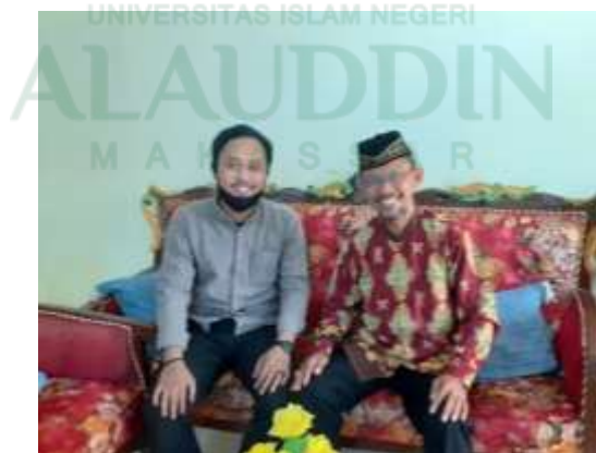
Dokumentasi Bersama Pendidik Mata Pelajaran Agama Islam SMA Negeri 2 Bantaeng