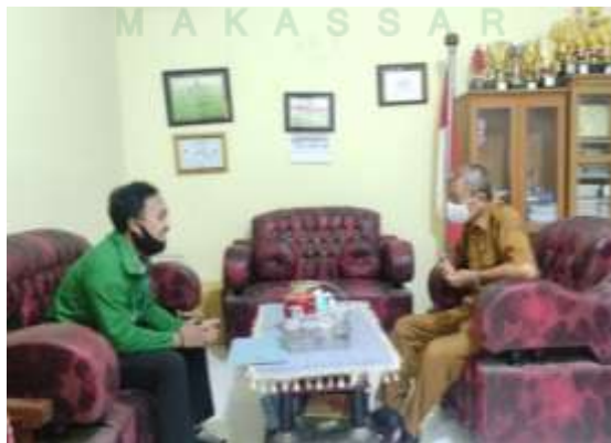
Dokumentasi bersama Kepala Sekolah SMA Negeri 2 Kab. Bantaeng