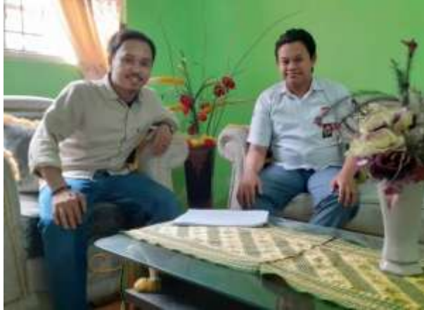
Dokumentasi bersama peserta didik SMA Negeri 2 Bantaeng