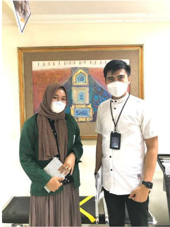
Gambar 1 : Wawancara dengan Consumer Financing Service BTN Syariah Makassar