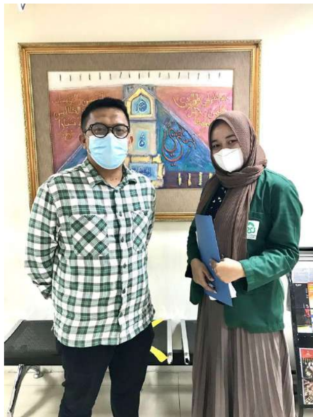
Gambar 2 : Wawancara dengan Consumer Financing Analyst BTN Syariah Makassar