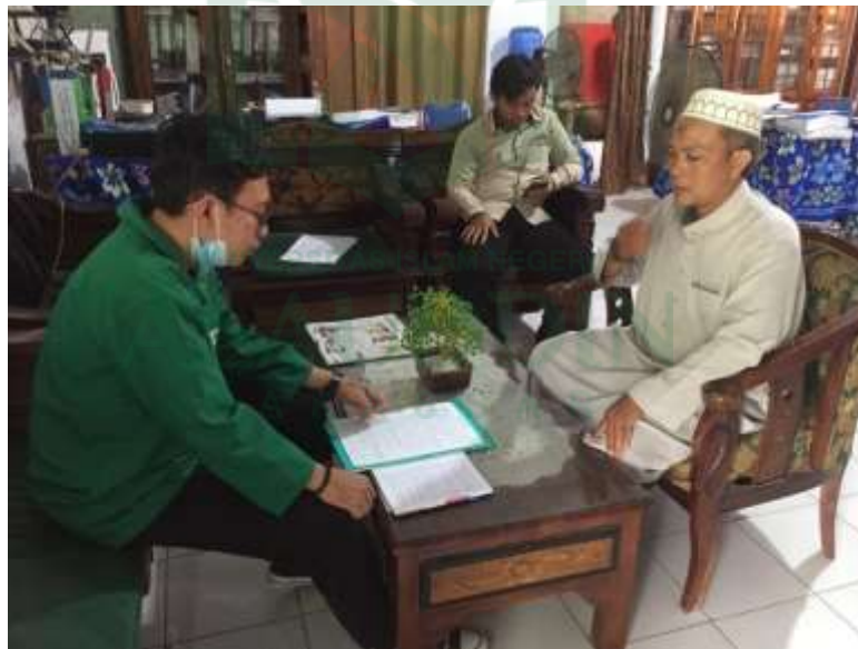
Kegiatan Wawancara Guru Akidah Akhlak