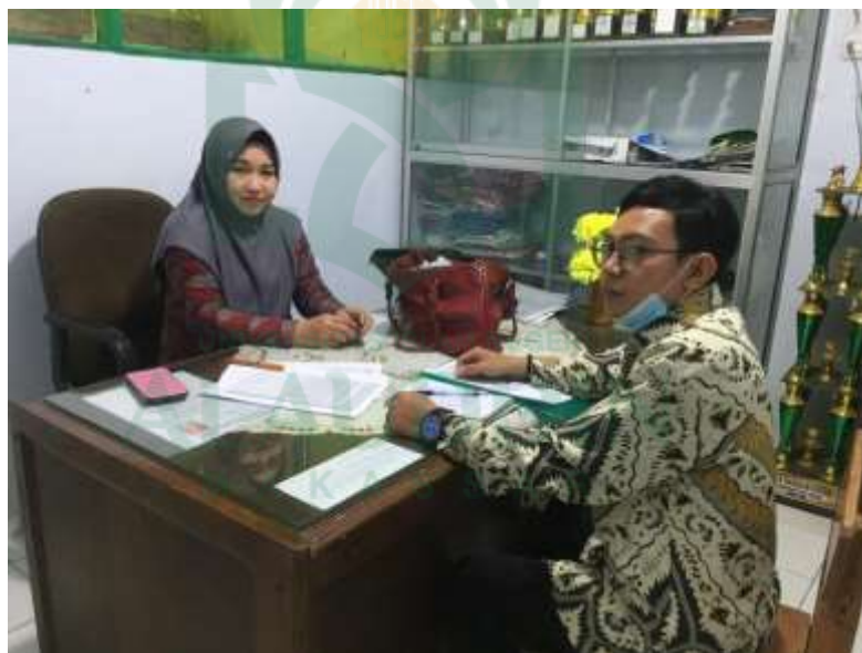
Kegiatan Wawancara Kepala Sekolah