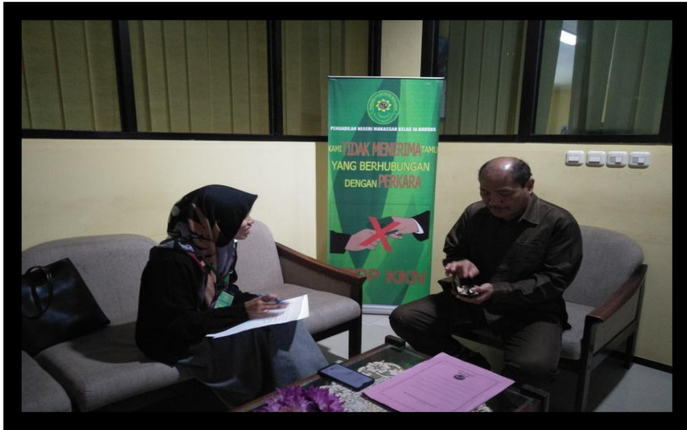
WAWANCARA DENGAN KETUA MAJELIS HAKIM DI PENGADILAN NEGERI MAKASSAR