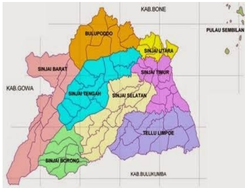
Gambar 4.1 Peta Kabupaten Sinjai