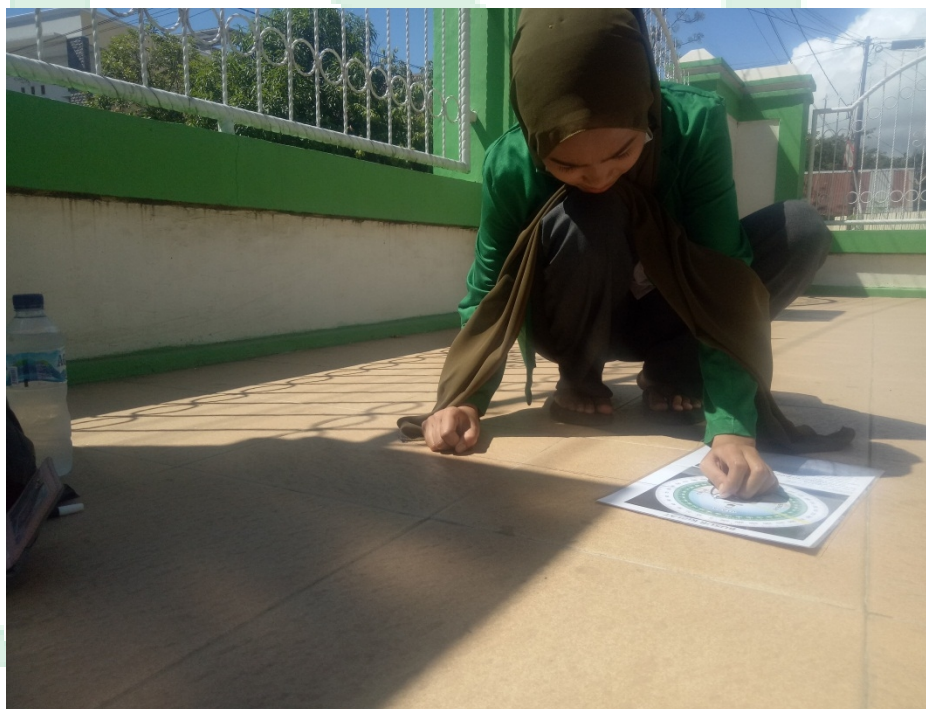
Gambar 2. Pengukuran Arah Kiblat Masjid Nur Balangnipa Dengan Menggunakan Busur Kiblat