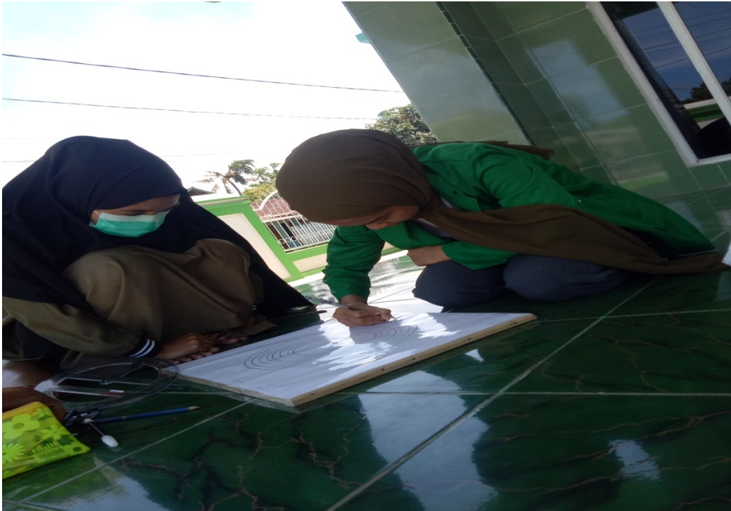
Gambar 5. Penentuan Shaf dengan Menggunakan Bantuan Tongkat Istiwa'