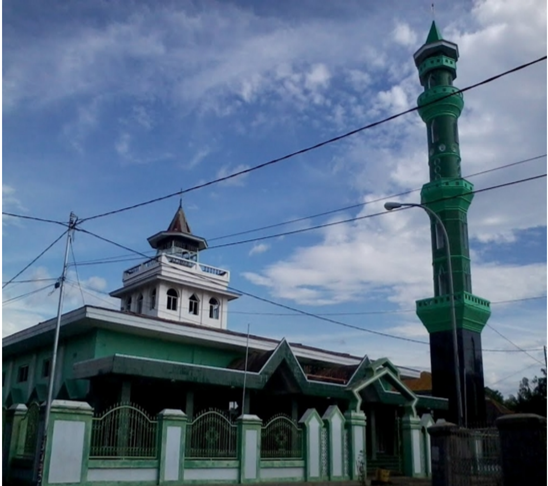
Gambar 4.2 Masjid Nur Balangnipa