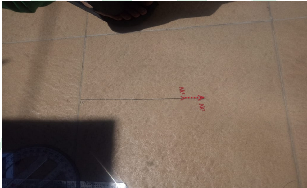
gambar 4. Hasil Pengukuran Arah Kiblat dengan Menggunakan Busur Derajat