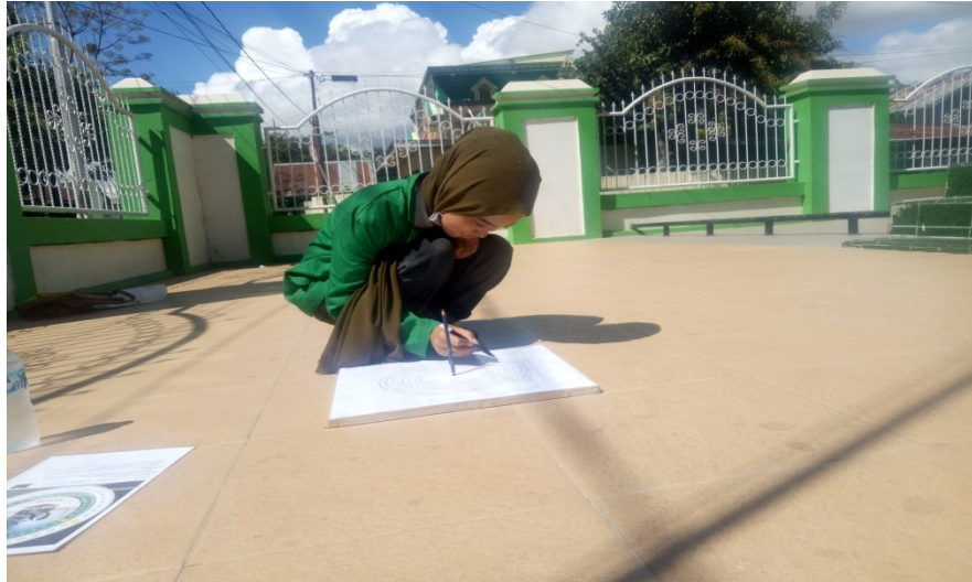
Gambar 1. Pengukuran Arah Kiblat Masjid Nur Balangnipa dengan Menggunakan Tongkat Istiwa'