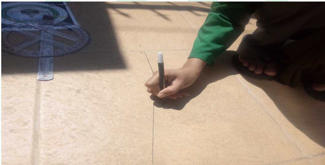
Gambar 6. Penentuan Shaf dengan Menggunakan Bantuan Busur Derajat