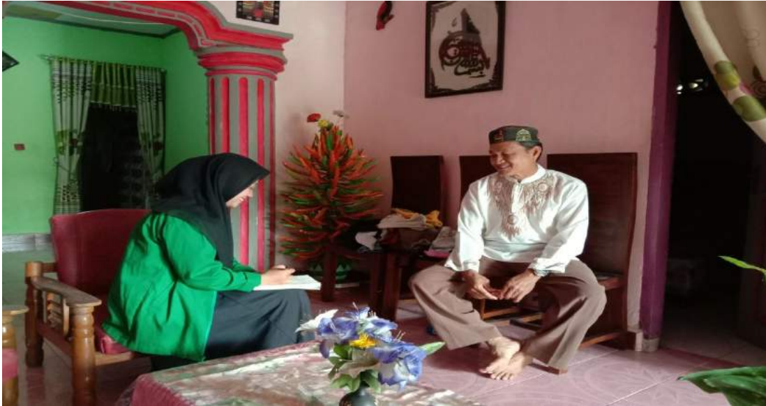
(Wawancara Bersama Imam Desa Gareccing)