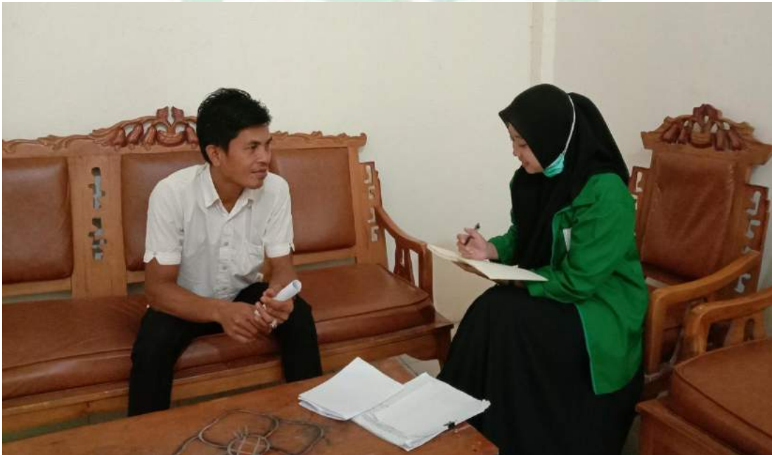
(Wawancara Oleh Masyarakat Desa Gareccing)