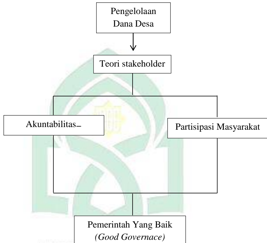
Gambar 2.1 Rerangka Pikir