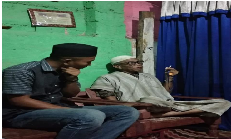
Gambar 3 Wawancara dengan tokoh agama (udstaz)