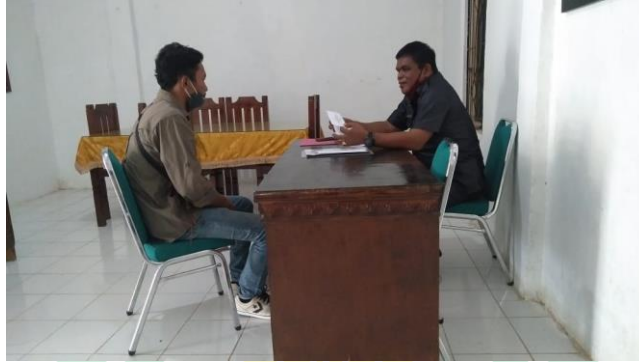
Gambar 1 Wawancara dengan bapak kepala Desa