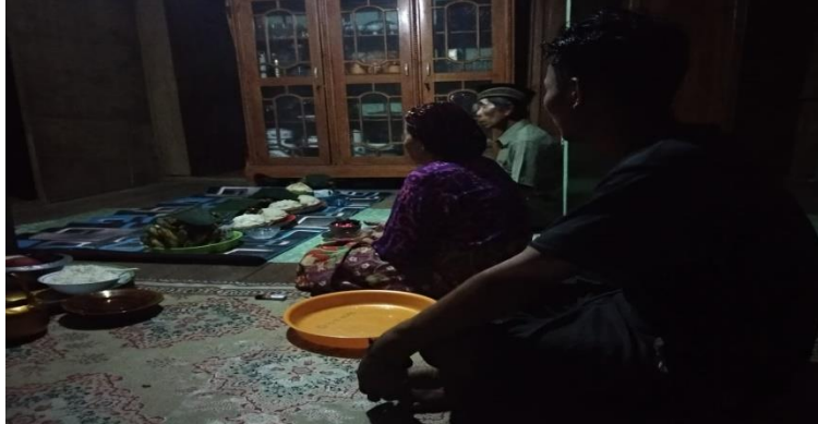
Gambar 6 Acara mabbaca