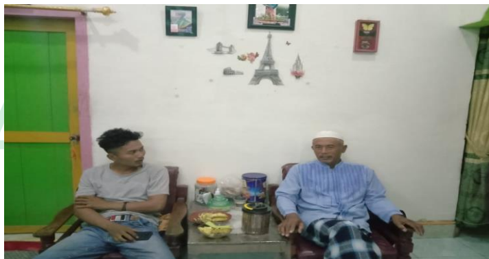
Gambar 2 Wawancara dengan tokoh masyarakat