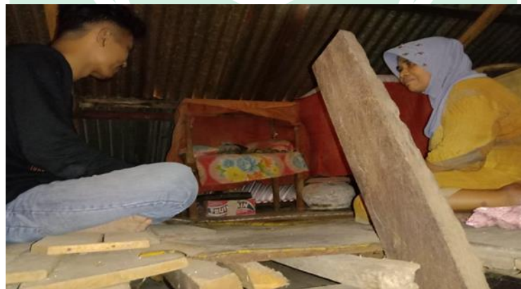
Gambar 4 Wawancara dengan pemilik boco'-boco'