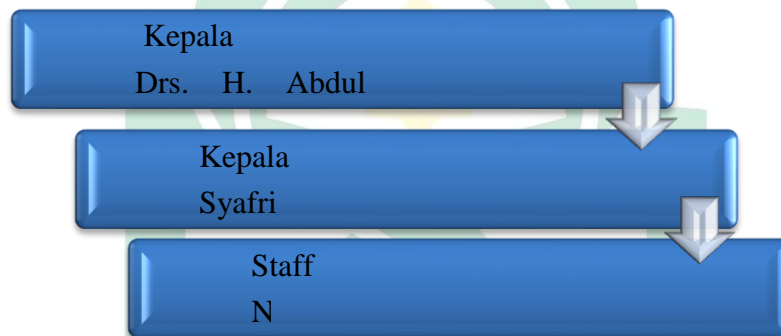
Gambar 1. Struktur Organisasi Perpustakaan

Struktur Organisasi Perpustakaan SMP Negeri 3 Tinggimoncong adalah sebagai berikut :