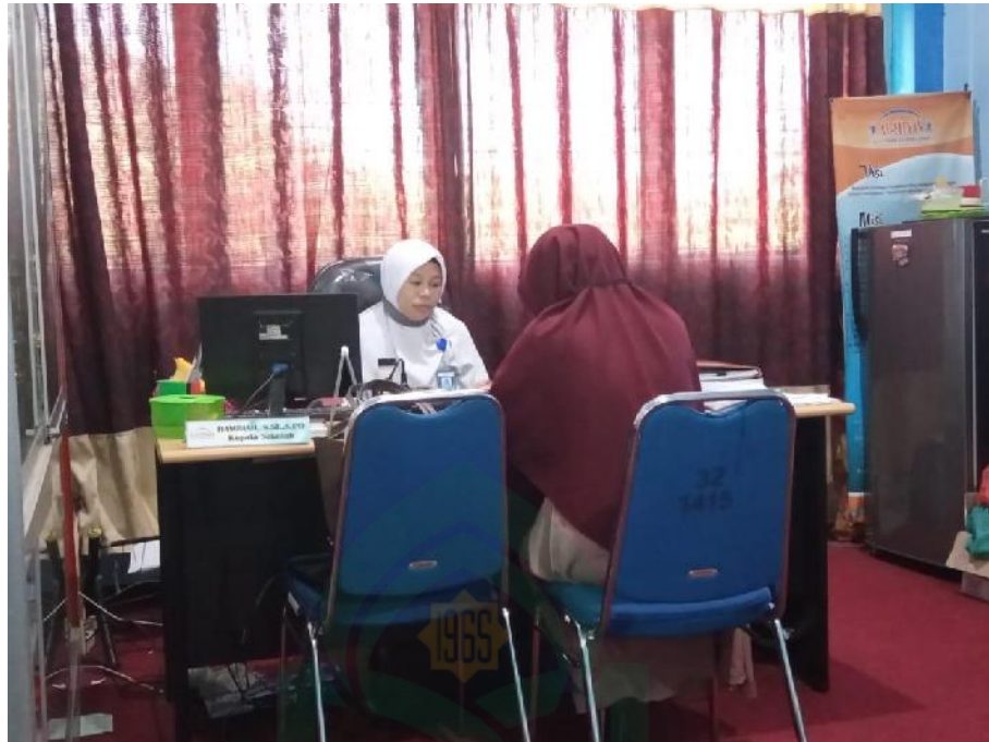
Wawancara dengan Kepala Sekolah SMPIT Al-Fityan School Gowa