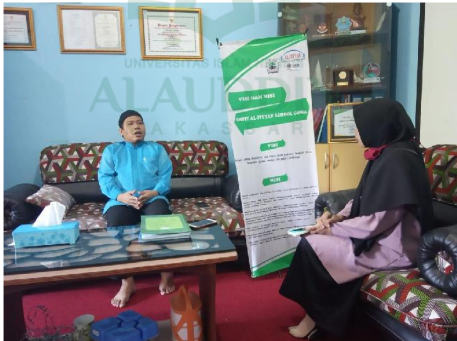
Wawancara dengan Wakil Kepala Kurikulum