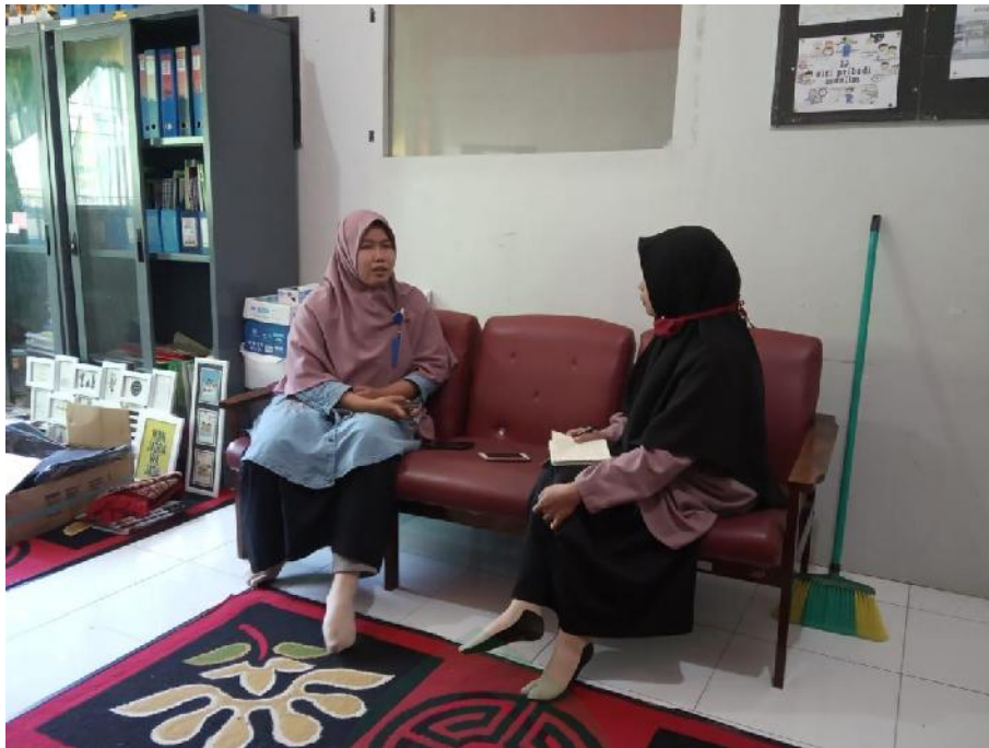
Wawancara dengan Guru Pendidikan Agama Islam