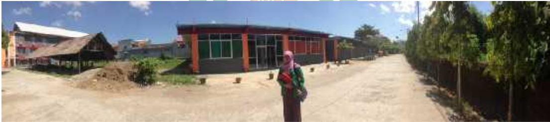
Kantor Pondok Madinah Putra

UNIVERSITAS ISLAM NEGERI ALAUDDIN M A K A S S A R