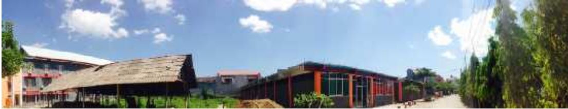
Bangunan Pondok Pesantren Madinah Putra