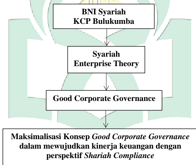
Gambar 2.1 Kerangka Konseptual

model dan alur penelitian. Dalam rerangka pikir, segala bentuk komponen penyusun penelitian ditampilkan secara simbolik dan disajikan dalam bentuk bagan sistematis dan bertujuan khusus. Kerangka konseptual ini disusun berdasarkan landasan teoritis yang digunakan dalam penelitian ini yang dapat direpresentasikan dalam gambar 1.1 berikut ini.