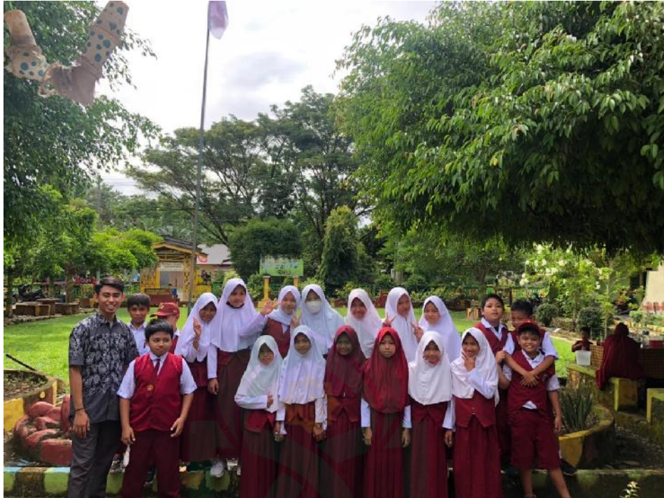
Foto Bersama Peserta Didik dan Pendidik Kelas V SDN 140 Lampuawa Kabupaten Luwu Utara