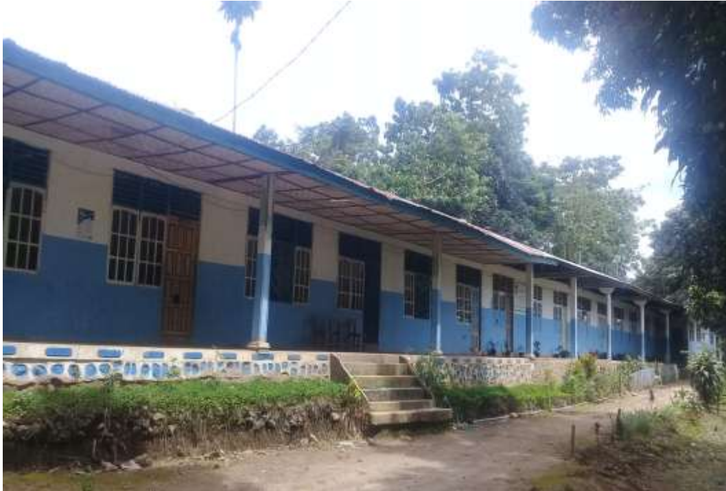
Masjid Jami' di MTs. DDI Nurussalam Lassa-Lassa