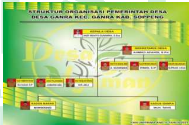
Gambar 4.5 Struktur Pemerintahan Desa Ganra