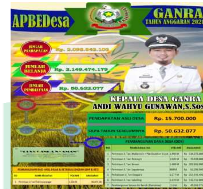
Gambar 4.6 Baliho/ Banner APBDesa Desa Ganra

Pemahaman mengenai mekanisme pengelolaan dana desa merupakan aspek penting dan mendasar yang harus dimiliki para pemangku kepentingan di pemerintah desa (pemdes), khususnya dalam mewujudkan transparansi dan akuntabilitas keuangan desa. Mekanisme pengelolaan dana desa dimulai dari tahap perencanaan sampai dengan pelaporan dan pertanggungjawaban keuangan desa. Pengelolaan dana desa juga harus dilakukan berdasarkan tata kelola pemerintahan desa yang baik ( good village governance ).