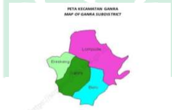
Gambar 4.3 Peta Desa Ganra yang dicitrakan dengan peta Kecamatan Ganra