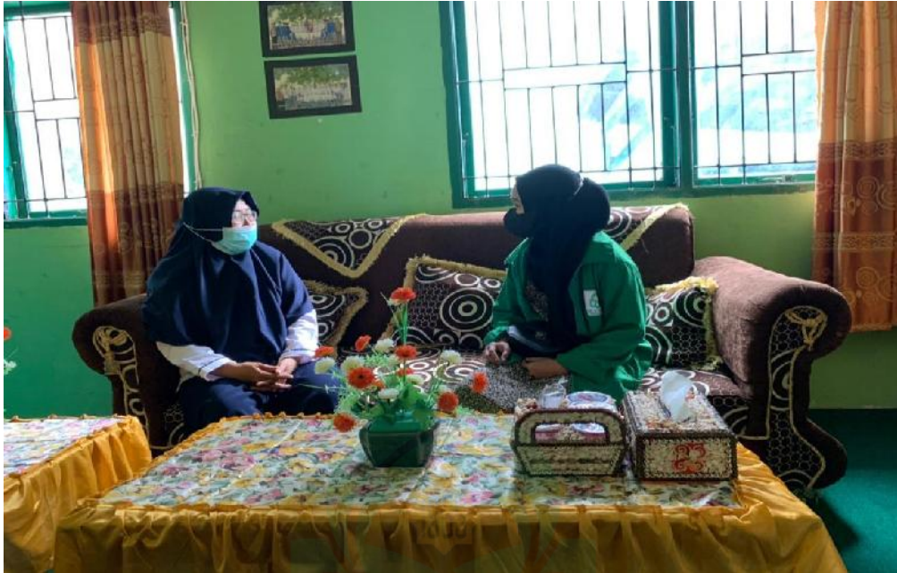
Foto bersama kepala perpustakaan saat memulai penelitian