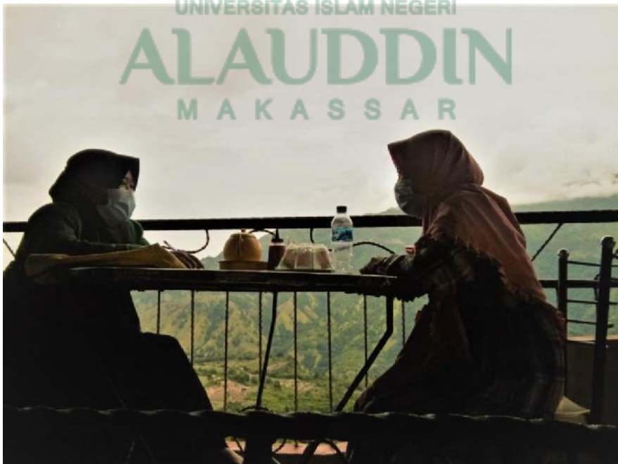
Wawancara Dengan Pengunjung