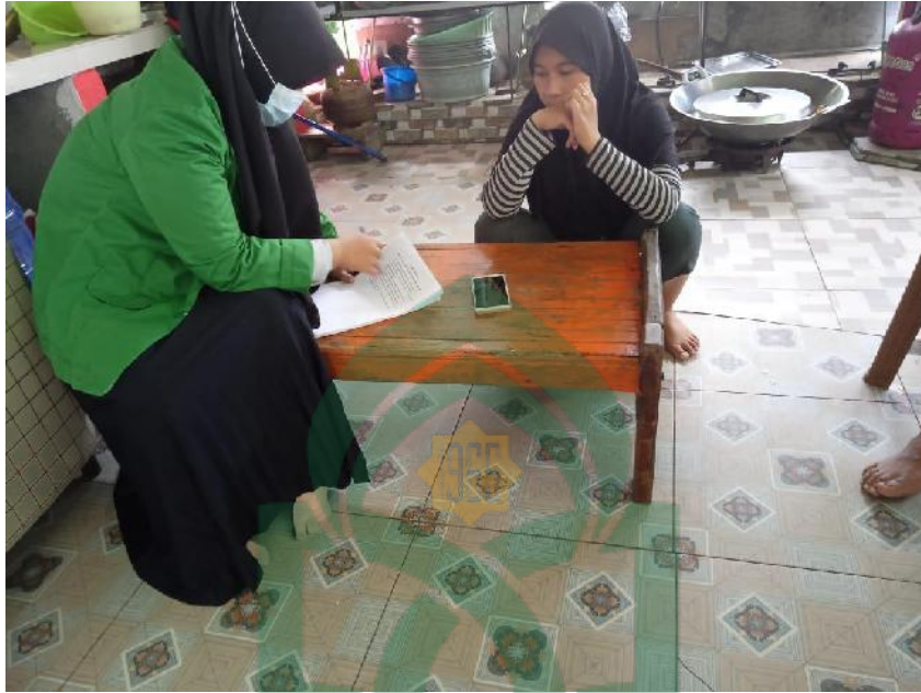
Wawancara Dengan Pemilik Rumah Makan