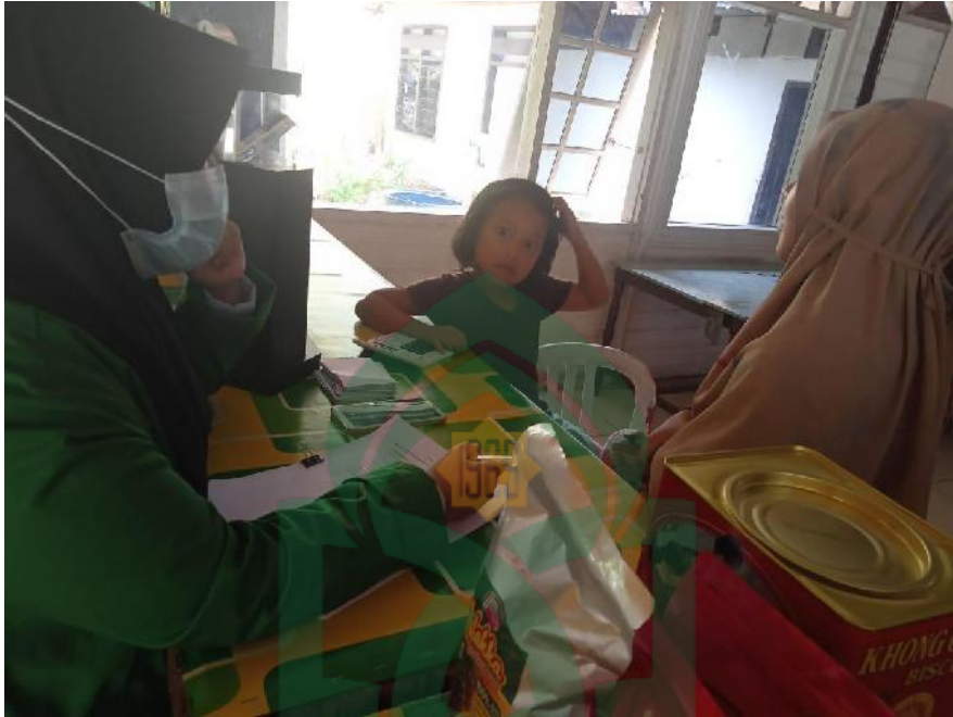
Wawamcara Dengan Pemilik Rumah Makan