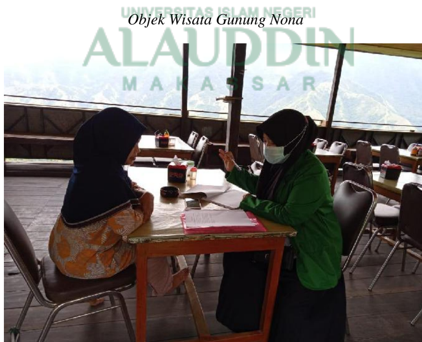
Wawancara Dengan Pemilik Rumah Makan