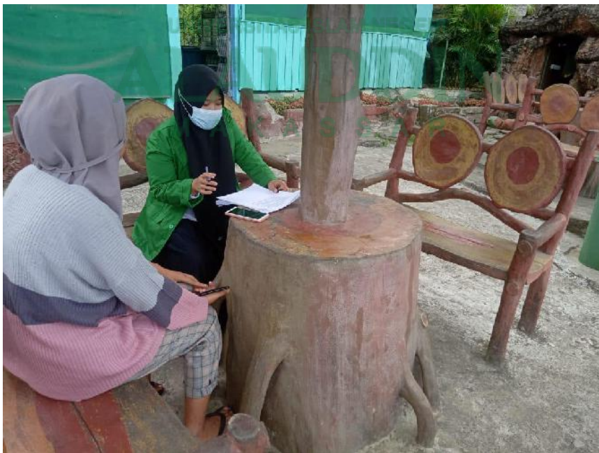
Wawancara Dengan Pemilik Rumah Makan